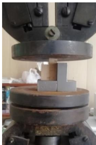
Рис. 2. Образец, закрепленный в специальном приспособлении под нагрузкой испытательной машины

В ходе эксперимента было сформировано четыре группы образцов. Первая, контрольная группа (К.О.), была склеена без активации клеевого слоя. Вторая (М1), третья (М2) и четвертая (М3) группы образцов выдерживались в инфракрасном нагревателе в течение 1, 2 и 3 мин соответственно для интенсификации склеивания путем предварительной активации клеевого слоя.