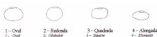
Figura 3 - Forma das sementes: oval, redonda, quadrada ou alongada.

Figure 2 - Seed color pattern: plain, ringed, mottled, speckled, mottled and speckled.