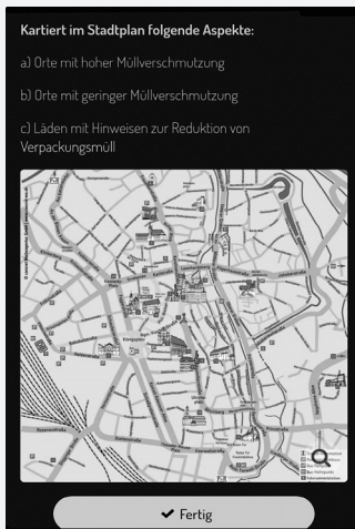
Screenshot einer exemplarischen Aufgabe in der Actionbound-App

Screenshot einer exemplarischen Aufgabe in der Actionbound-App ➔