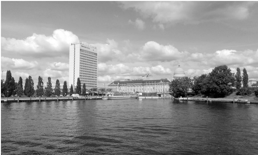
Abb. 2: Foto des im Field Sketch dargestellten Raumes