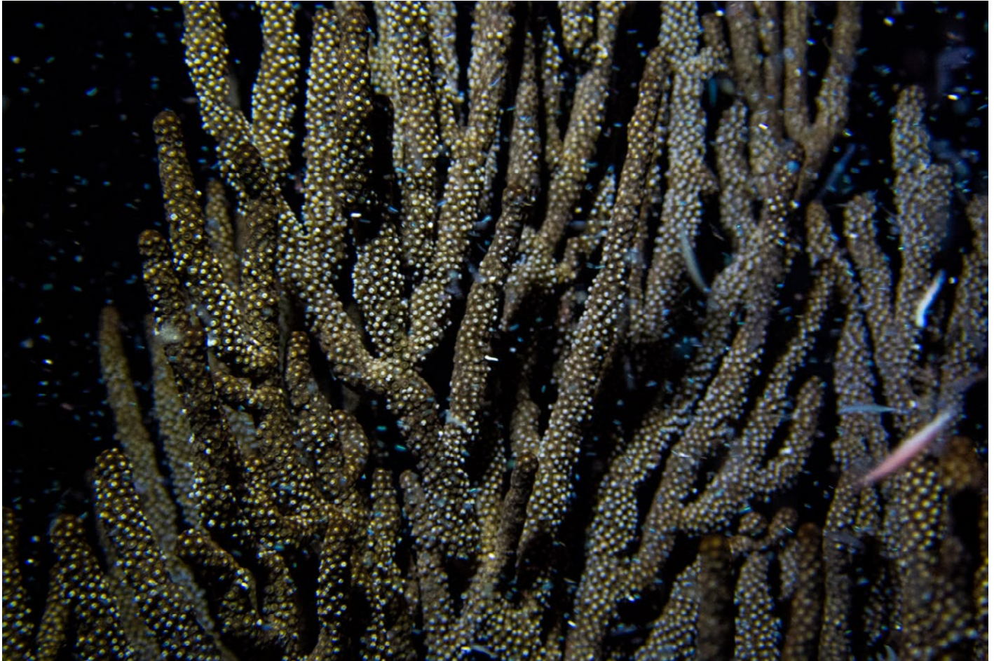
Fig. 2. Colonia de Plexaura homomalla liberando los gametos, Parque Nacional Guanahacabibes, Cuba.