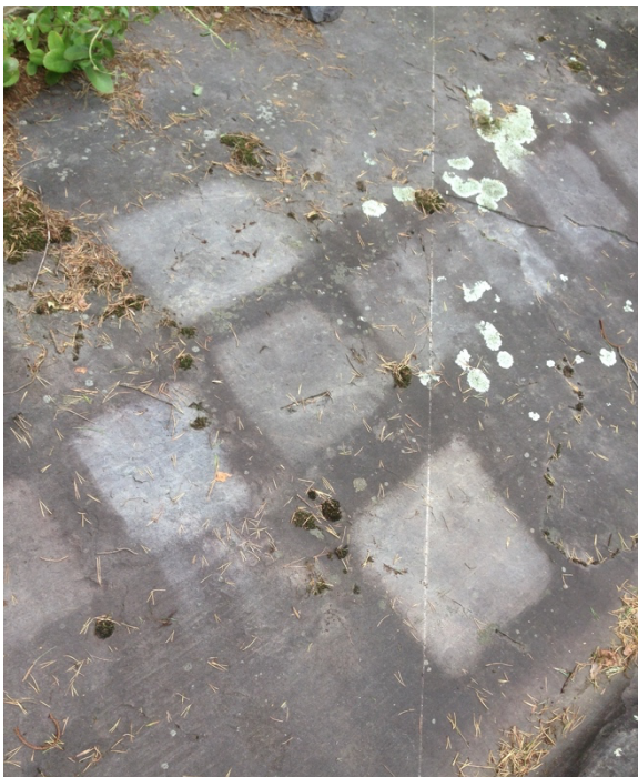
Figura 3 - Nazionale delle Incisioni Rupestri di Naquane: alcuni dei tasselli di prova oggetto di monitoraggio

Dalle analisi statistiche dei dati ricavati dallo studio è emerso come la presenza di terreno e vegetazione erbacea a monte delle rocce e di chiome di alberi che fanno ombra siano elementi decisivi nel favorire una più rapida ricolonizzazione dopo gli interventi di restauro. Nella primavera del 2018, inoltre, è stato avviato uno studio sul campo che mette a confronto gli effetti di diversi prodotti utilizzati dai restauratori negli interventi di pulitura. Alcuni trattamenti testati sono in uso nella pratica corrente degli interventi di restauro, altri sono in fase di valutazione sperimentale, fra cui l'uso di metaboliti prodotti da piante o