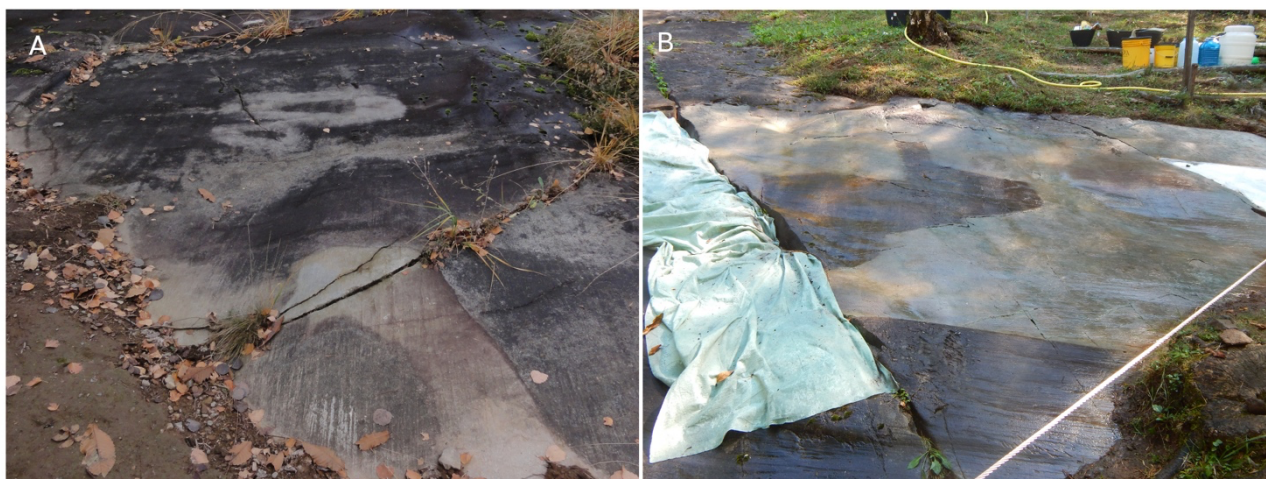
Figura 1 Parco Nazionale delle Incisioni Rupestri di Naquane, Roccia 70 (A) colonizzazione di biofilm (B) fasi di pulitura

Uno dei luoghi in cui l'esigenza della tutela dell'arte rupestre è molto sentito è il sito UNESCO n. 94 "Arte rupestre della Valle Camonica": primo sito italiano inserito, nel 1979, nella Lista del Patrimonio Mondiale dell'UNESCO. All'interno del sito è presente il Parco Nazionale delle Incisioni Rupestri di Naquane (Capo di Ponte, Brescia), primo parco archeologico italiano istituito nel 1955. La presenza delle comunità litobionti è un problema già noto fin dalla scoperta delle incisioni in Valle, agli inizi del 1900: la gestione della presenza delle patine costituite dai microrganismi è sempre stata necessaria per poter offrire, sia agli studiosi che ai visitatori, una buona accessibilità alle superfici istoriate (figura 1).