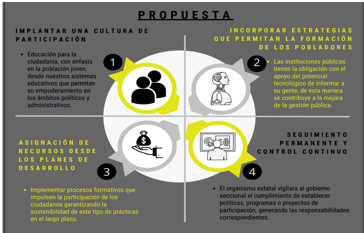
Figura 2 Representación grafica de la propuesta.