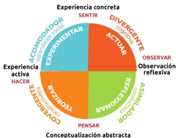
Figura 1: Estilos de aprendizaje de Kolb. 1

más utilizada es la propuesta por el modelo de aprendizaje experiencial de Kolb [22] (cfg. figura 1), que describe los siguientes estilos de aprendizaje: