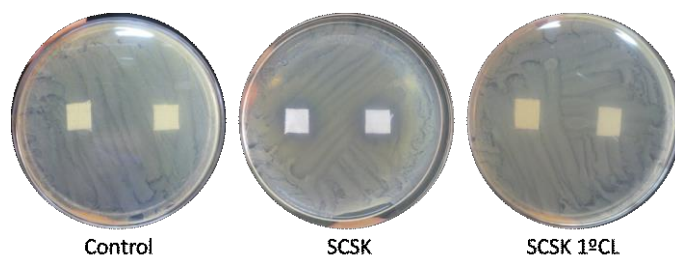
Figura 2. Imágenes fotográficas del ensayo frente a Staphylococcus aureus