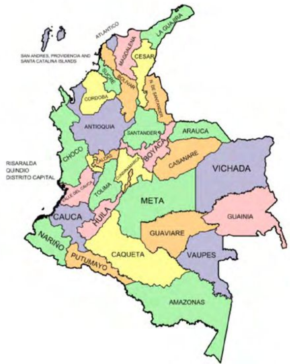
Figura 1. División política de Colombia