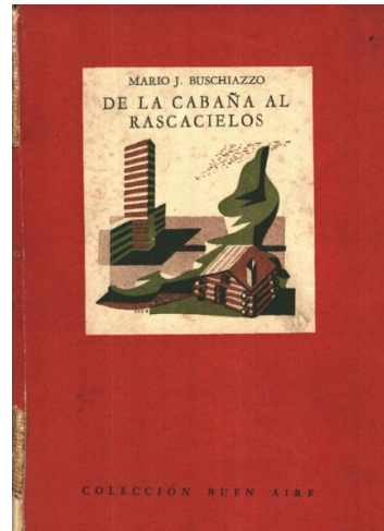
Figura 2. Portada del libro. Se ve una modesta cabaña en lo que aparenta ser el fragmento de un bosque. Al lado, un rascacielos de líneas simples.

Fuente. Buschiazzo, M. J. (1945). De La Cabaña al Rascacielos , Emecé Editores S.A.