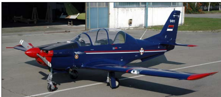
Slika 3 – Avion Lasta Figure 3 –Swallow Aircraft

Avion Lasta je jednomotorni avion, tipa niskokrilac, sa dva sedišta u tandem konfiguraciji, sa maksimalnom poletnom masom od 1280 kg i razmahom krila od 9.7 m. Slika aviona Lasta dat je na slici 3. Avion je opremljen šestocilindričnim klipnom motorom tipa Lycoming AEIO-540-L1B5D maksimalne snage P_{\max}=224 kW (Gaćeša, 2009, pp. 142–143).