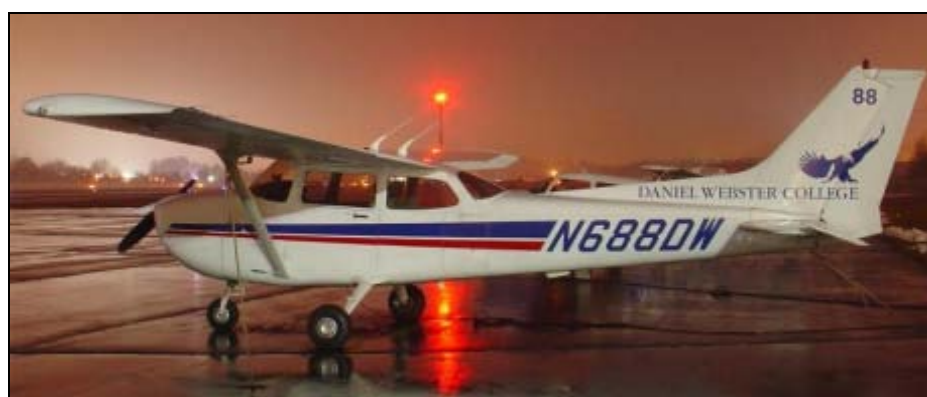
Slika 1 – Avion Cessna 172 Daniel Webster College Figure 1 – Aircraft Cessna 172 of Daniel Webster College

Na slici 2 prikazan je avion laboratorija tipa Jetstream 31 Cranfield Univerziteta koji se koristi za post-diplomsko usavršavanje studenata u oblasti aerodinamike i mehanike leta. Ovaj tip aviona laboratorije omogućava i školovanje studenata i u oblasti savremenih avionskih sistema (radara, navigacije, glass cockpit, itd.).