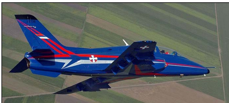
Slika 4 – Avion Galeb G-4 Figure 4 –Seagull G-4 Aircraft

Avion Galeb G-4 je jednomotorni avion, tipa niskokrilac, sa dva sedišta u tandem konfiguraciji, sa maksimalnom poletnom masom od 6300 kg i razmahom krila od 9.9 m. Slika aviona Galeb G-4 dat je na slici 4. Avion je opremljen turbomlaznim motorom tipa Rolls-Royce Viper 632–46 sa maksimalnim potiskom F_{\max}=17,8 kN.