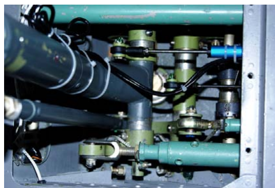
Slika 6 – Instalacija mernog pretvarača otklona palice po uzdužnoj osi Figure 6 – Sensor installation of longitudinal stick position