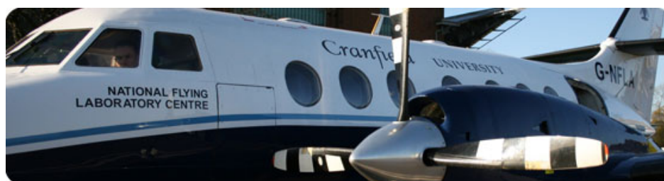
Slika 2 – Avion laboratorija Jetstream 31 Cranfield Univerziteta Figure 2 – Flying laboratory Jetstream 31, Cranfield University