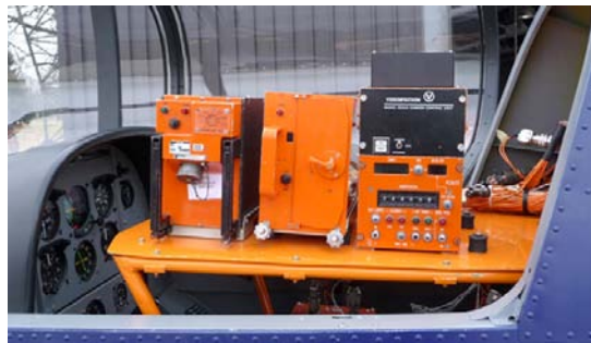
Slika 5 – Akvizicioni sistem na avionu Figure 5 – Acquisition system on aircraft

Tehnički Opitni Centar poseduje više tipova i generacija digitalnih akvizicionih sistema koji mogu biti upotrebljeni za proces edukacije studenata Vojne akademije u oblasti ispitivanja u letu. Na slici 5 prikazan je akvizicioni sistem integrisan na avion Lasta, a na slici 6 prikazan je način integracije mernog pretvarača (linearni potenciometri) položaja otklona palice po uzdužnoj osi (Paulo, 2008, pp. 243–252).