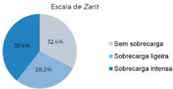
FIGURA 3. Distribuição do grau de sobrecarga para os cuidadores através da aplicação da escala de Zarit.

Há relação estatisticamente significativa ( p=0,001 ) entre o grau de sobrecarga dos cuidadores e a existência de depressão. Por outro lado, não se verifica uma relação estatisticamente significativa entre o grau de dependência e o grau de sobrecarga ( p=0,977 ).