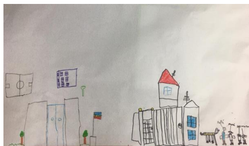
Escuela en Venezuela