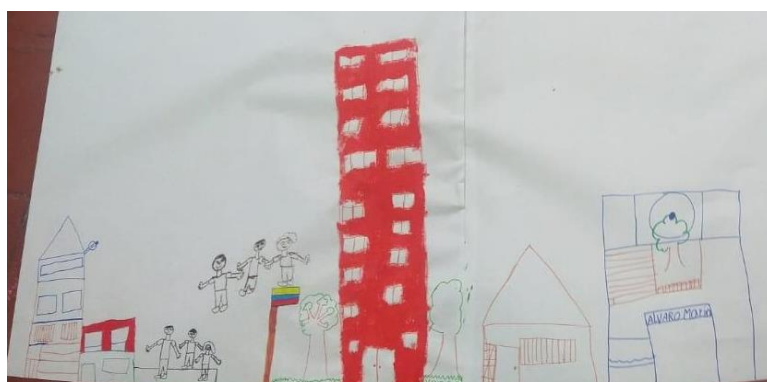
Escuela en Venezuela