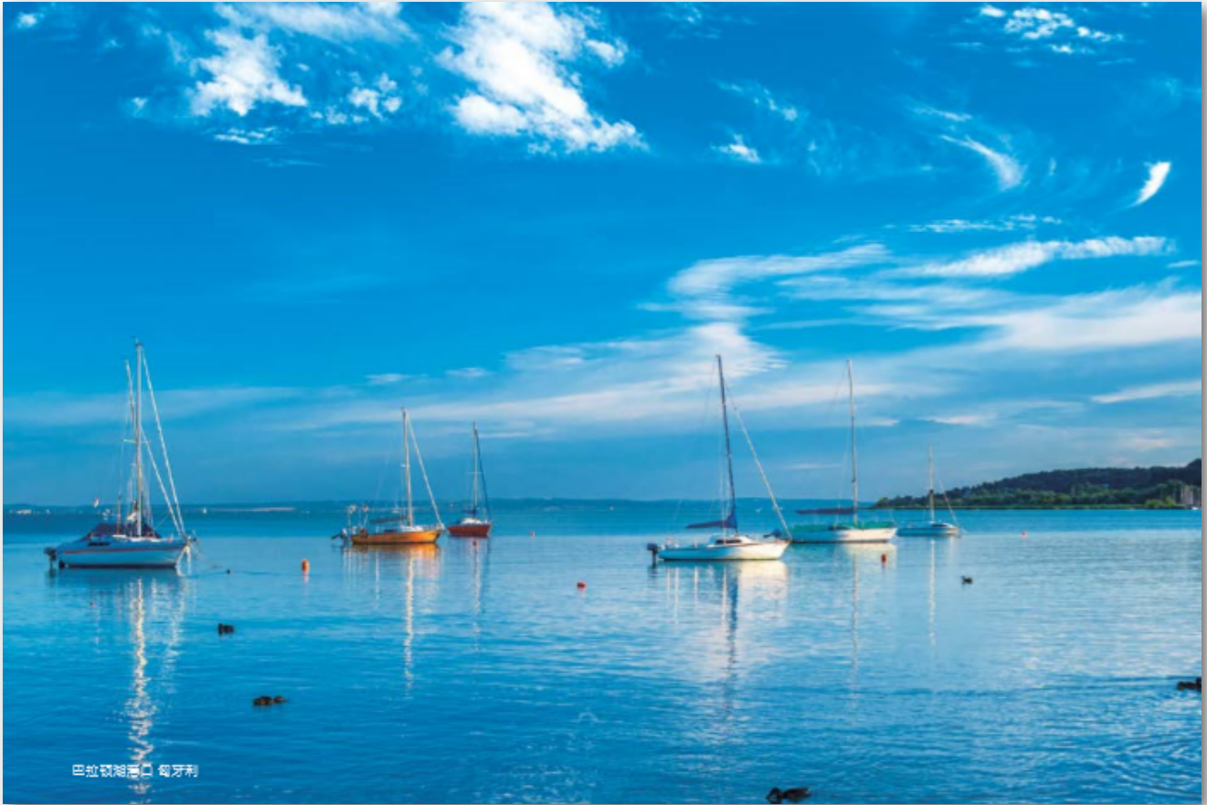
- 匈牙利 巴拉顿湖 -

https://tvpworld.com/70598285/intel-to-carry-out-largest-greenfield-investment-in-polands-history