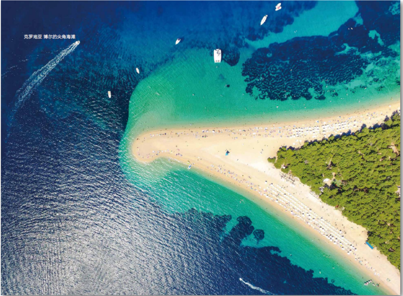
- 克罗地亚 博尔的尖角海滩 -