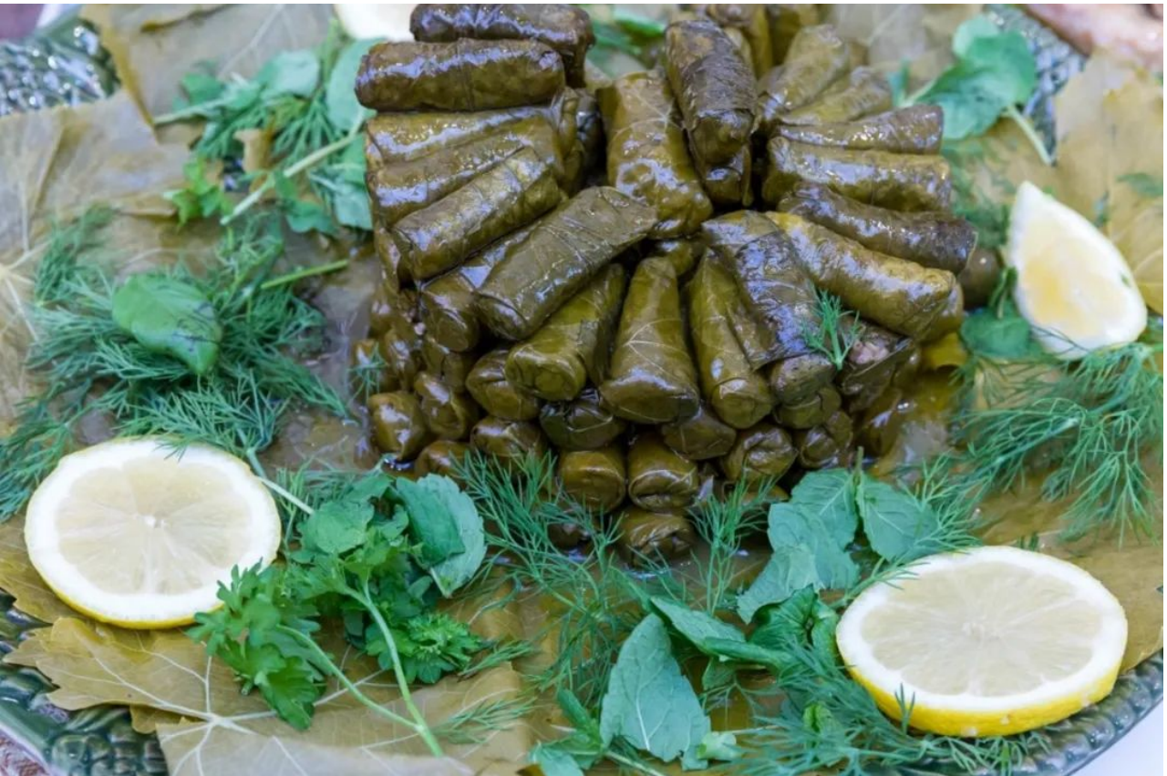
煮熟后的希腊粽子 [3]

当家庭成员团聚或朋友聚会时，一份丰盛的希腊粽子是颇受欢迎的冷盘或热菜，大家可以边品尝边聊天，共同度过愉快的时光。此外，希腊粽子是希腊复活节期间的传统美食之一。在这一重要的宗教节日里，人们会准备大量的希腊粽子，与亲朋好友一起庆祝新生命和希望的到来。