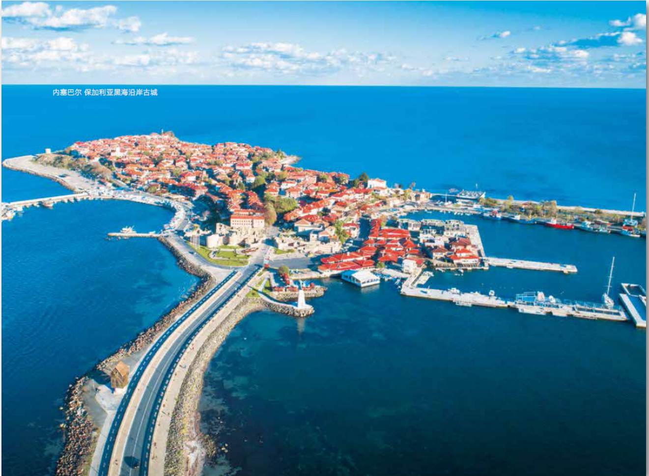
内塞巴尔 保加利亚黑海沿岸古城

https://www.logupdateafrica.com/cargo-drones/dronamics-black-swan-cargo-drone-takes-first-flight-in-bulgaria-1348812?infinitemscroll=1 , https://therecursive.com/the-black-swan-takes-off-as-dronamics-makes-its-first-cargo-drone-flight-test/ , https://www.flyingmag.com/drone-cargo-airline-dronamics-completes-1st-flight-of-flagship-aircraft/ , https://www.youtube.com/watch?time_continue=102&v=hZfGrLnSZdQ&embeds_referring_euri=https%3A%2F%2Fwww.logupdateafrica.com%2F&source_ve_path=MzY4NDIsMjg2NjY&feature=emb_logo