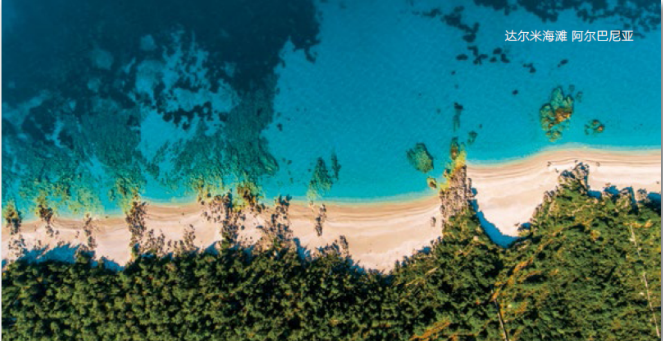
达尔米海滩 阿尔巴尼亚