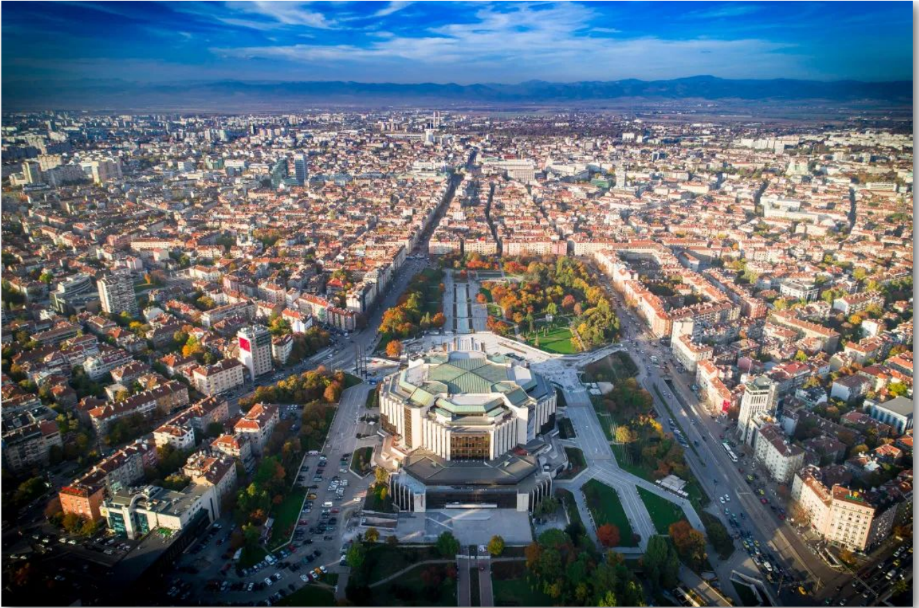
- 保加利亚 索菲亚市中心的国家文化宫 -