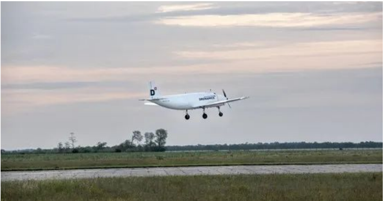
保加利亚初创企业的货运无人机试飞成功 (1)