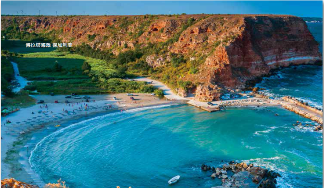
- 保加利亚 博拉塔海滩 -