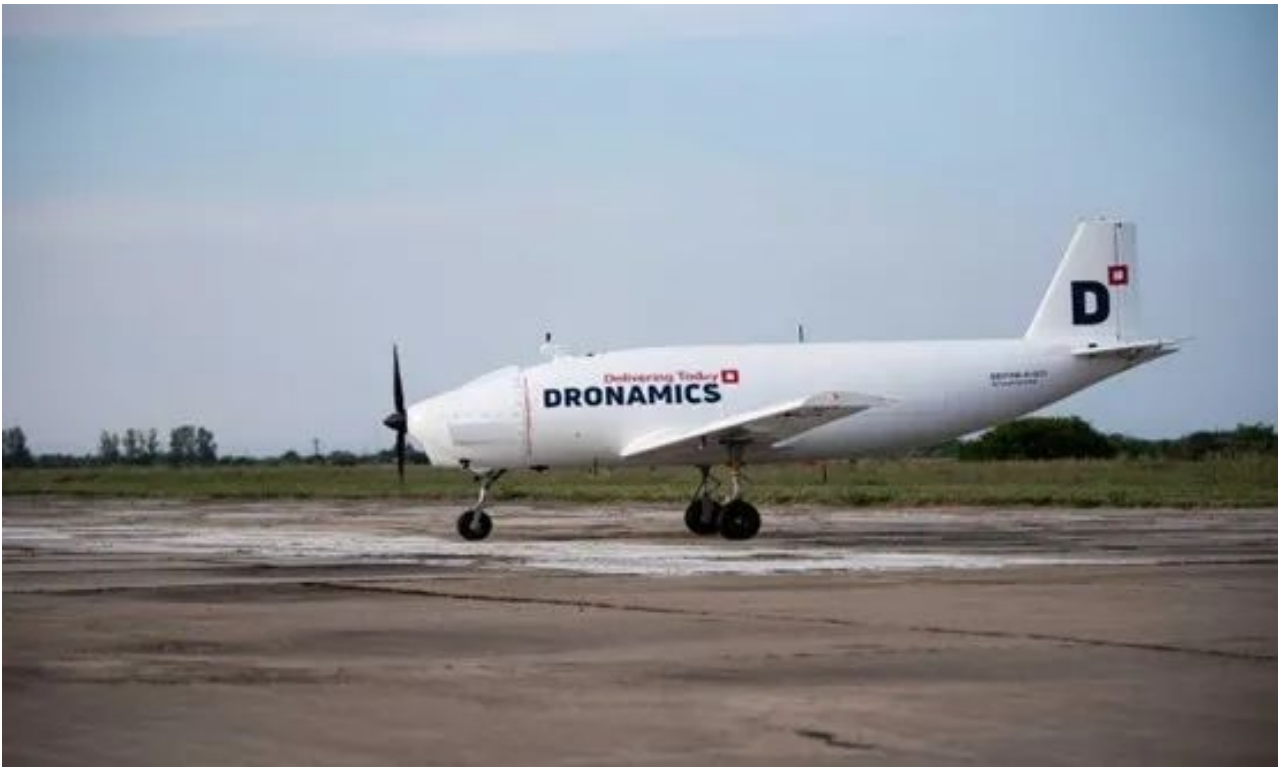
保加利亚初创企业的货运无人机试飞成功 (2)