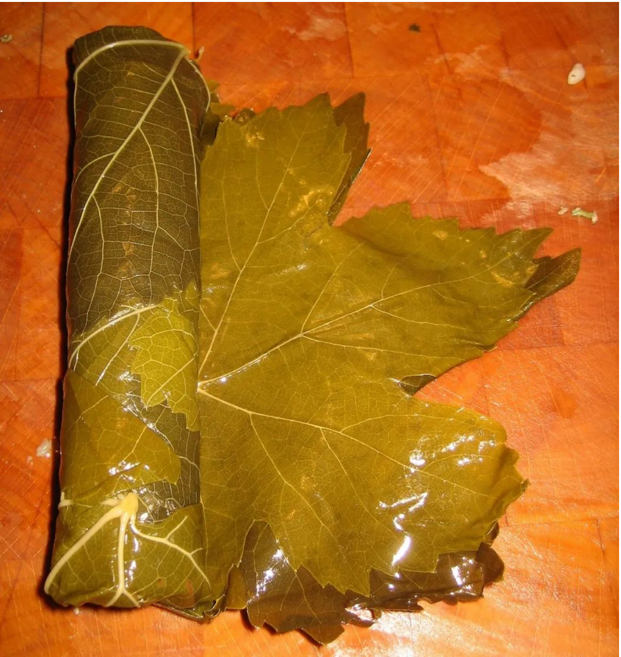
使用葡萄叶包裹的希腊粽子 [2]

希腊粽子被视为一种常见的传统美食，既可以作为开胃冷盘食用，有时也可作为热腾腾的主食，这时候粽子里可能会包上羊肉等肉馅，再搭配由蛋黄和柠檬汁调制而成的鸡蛋柠檬酱（Avgolemono）。希腊粽子常常出现在各种家庭聚会和庆祝活动中，如婚礼、节日和生日。此外，其在餐厅和咖啡馆也是一道备受喜爱的菜品。