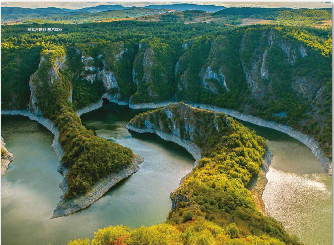
乌瓦河峡谷 塞尔维亚

https://www.serbianmonitor.com/en/chinas-jiangsu-lianbo-precision-to-open-factory-in-serbia/