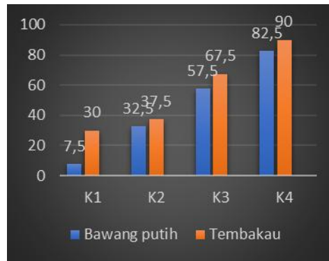
Gambar 9. grafik persentase mortalitas hama kutu kebul

Keberhasilan suatu pestisida terletak pada dua faktor yaitu faktor abiotik (alam) serta faktor teknis penyemprotan. Menurut McLaughlin (2020) faktor abiotik adalah faktor tidak hidup yang mempengaruhi suatu keadaan lingkungan seperti angin, hujan, kelembaban, temperature, komposisi tanah, kandungan garam pada air tanah dan lainnya. Sedangkan faktor teknis menurut Balitsa (2015) keberhasilan dalam aplikasi pestisida terletak pada kecepatan berjalan, arah dan jarak sprayer yaitu sejauh 30 cm serta searah dengan angin, yang terakhir adalah arah ayunan semprot.