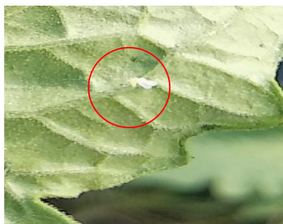
Gambar 8. Lingkaran merah merupakan contoh imago kutu kebul setelah aplikasi pestisida nabati

Pada perlakuan bawang putih juga menunjukkan tingkat mortalitas tinggi pada perlakuan B4 (60%), menurut pendapat Challem dalam Moulia et al (2018) , bawang putih ( Allium sativum ) memiliki lebih dari 100 metabolit sekunder yang mampu berperan sebagai antimikroba diantaranya adalah alliin, alliinase, allisin, S-allilsistein, diallil sulfida, allil metil trisulfida. Adapun pendapat Tigauw et al (2015) yang mengatakan bahwa kandungan senyawa kimia pada bawang putih seperti alkanoid, flavonoid, saponin, tannin dan sulfur dipercaya mampu menurunkan populasi kutu pada tanaman budidaya.