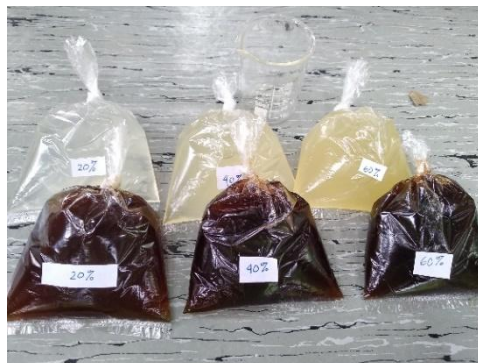
Gambar 10. Pestisida nabati bawang putih dan tembakau dengan konsentrasi yang berbeda

Tidak adanya pengaruh interaksi yang terjadi pada perlakuan diakibatkan karena pada saat penyemprotan pestisida nabati bawang putih dan tembakau dilakukan pada jam-jam yang sudah terik yaitu pukul 9.30. Menurut pendapat Pramono dalam Artini et al (2013) beberapa senyawa seperti minyak atsiri pada suatu tanaman mudah menguap bahkan dalam suhu ruangan serta mudah tercampur dengan bahan pelarut organik.