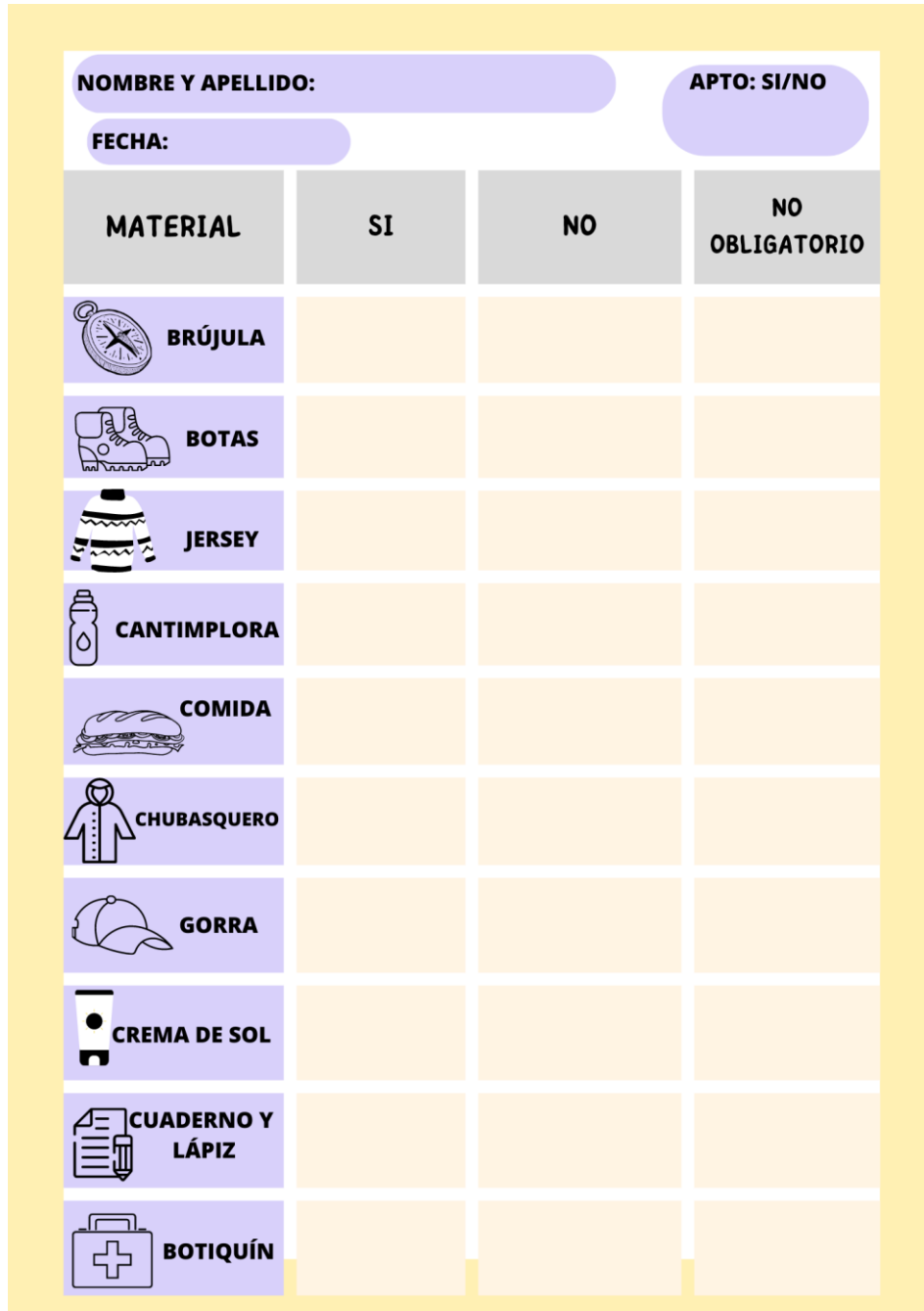
Ficha ITM