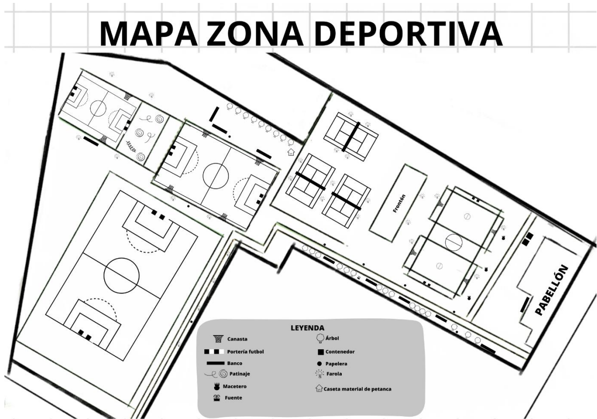
Plano de las instalaciones deportivas (Autoría propia)