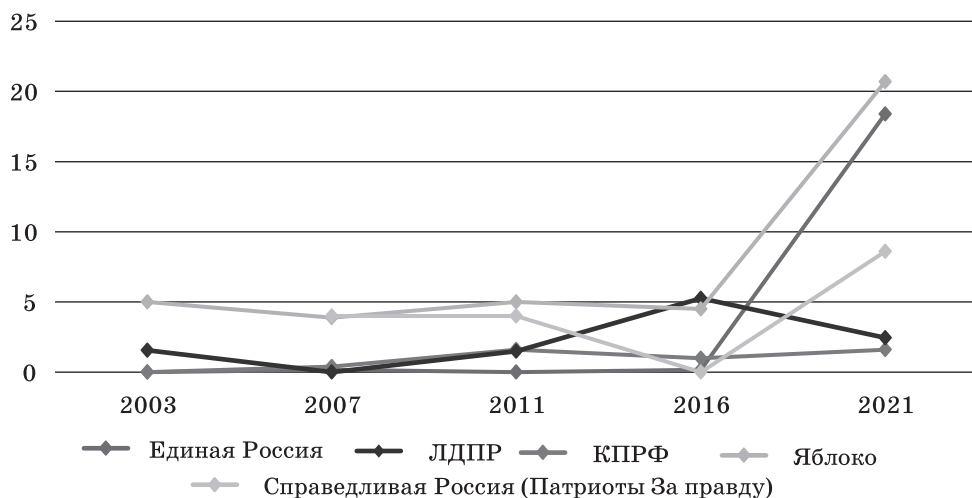
Рис. 2. Доля текста, посвященного экологической проблематике, в предвыборных программах основных российских политических партий с 2003 по 2021 гг.

В целом можно отметить, что в некоторых случаях российские политические партии пытались встроить экологическую проблематику в свою общую политическую линию (рис. 2). Например, левые партии (СР, ЛДПР, КПРФ) часто вносили в свои