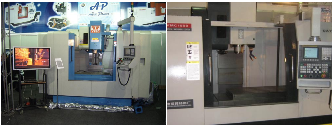
شكل ( ١ ) ماكينات CNC