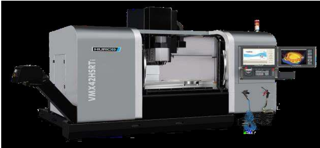
شكل ( ٢ ) مكونات نظام CNC

ويمكن توضيح مكونات النظام وأجزائه من خلال شكل ( ٢ ):