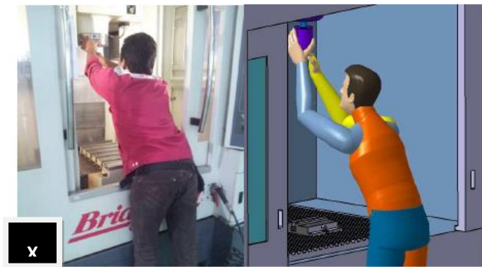
وضع ارجونومي غير سليم

في برنامج CATIA ، تم إنشاء مانيكان manikin بناءً على قياس الأنثروبومترية للآلات. وبالتالي ، تم نقل رسم آلة التفريز CNC إلى وحدة تحليل النشاط البشري human activity analysis module في برنامج CATIA ، وتم وضع المانيكان الذي تم إنشاؤه في الماكينة. بالإضافة إلى ذلك ، تم قياس الوضع الارجونومي للمانيكان على غرار الحالة الفعلية باستخدام وحدة محرر الوضع الارجونومي بالبرنامج posture editor module . ( Isa Halim et al. ) (2014، al.