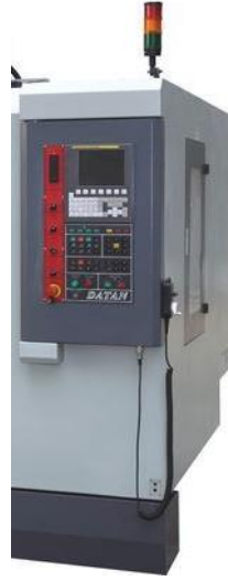
شكل ( ٤ ) مكونات الوحدة التحكم الرقمي

أما وحدة التحكم فتختلف من حيث اللغة المستخدمة للبرمجة ونظام وحدة التحكم، وتشارك في المكونات التالية:-