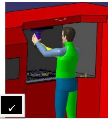
وضع ارجونومي سليم

شكل ( ٥ ) الأوضاع الأرجونومية لوحدة التحكم الرقمي افتراضياً