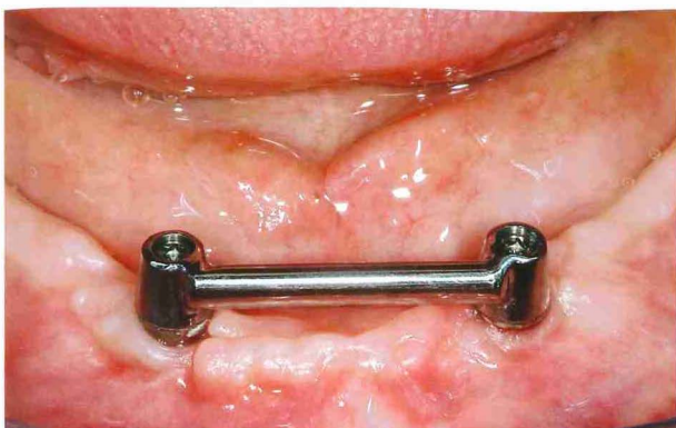
Afb. 1. Twee implantaten met staaf-hulsmesostructuur.

ge eeuw geïntroduceerd (Naert et al, 1988). Gebleken is dat in de meeste gevallen (standaardpatiënten) 2 implantaten voldoende zijn om op lange termijn de orale functie met voldoende tevredenheid te herstellen (Wismeijer et al, 1997; Batenburg et al, 1998a; Batenburg et al, 1998b; Wismeijer et al, 1998; Timmerman et al, 2004). In het algemeen geven magneet-, drukknop- en staaf-hulsmesostructuren dezelfde resultaten qua overleving en peri-implantaire klinische en röntgenologische parameters. Een staaf-hulsmesostructuur geeft echter een betere retentie en op middellange termijn minder nazorg (Naert et al, 1998; Wismeijer et al, 2001; Van Kampen et al, 2003; Stoker et al, 2007). Bij de keuze tussen de verschillende staaf-hulssystemen blijkt in de praktijk een dikke eivormige Dolder-staaf met bijbehorende huls weinig nazorg te geven. De huls geeft een goede retentie en deactiveert niet snel.