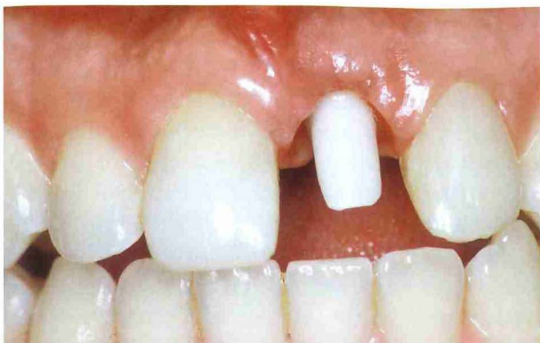
Afb. 3. Een individueel vervaardigde keramische implantaatopbouw.