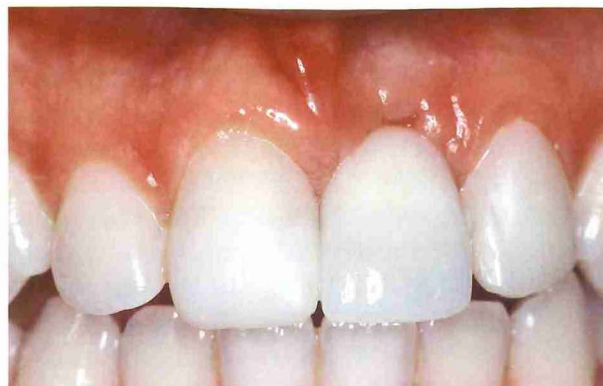
Afb. 4. Keramische kroon gecementeerd op de implantaatopbouw van afbeelding 3.