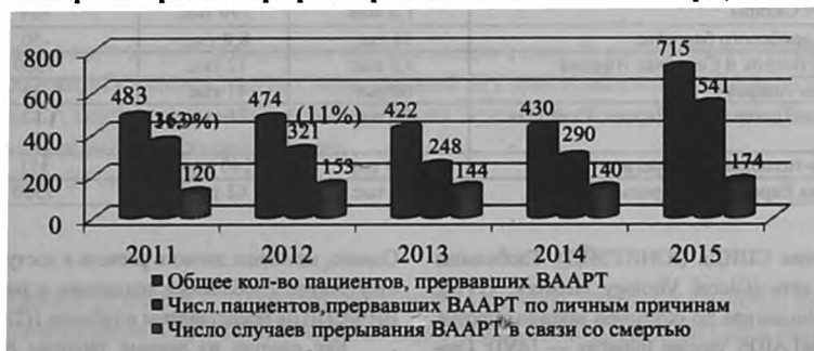
Рисунок 2. Динамика ВИЧ-инфицированных лиц, прервавших ВААРТ (2011-2015 гг.) (абс.)