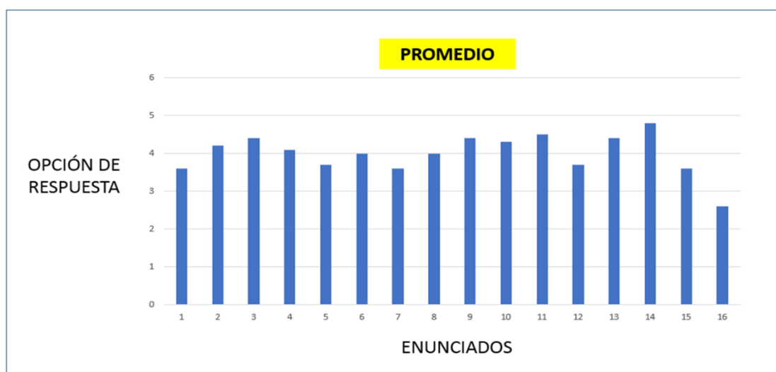
Figura 2. Promedio por enunciado.

El promedio general es: 4, y el promedio de cada enunciado se muestra en el siguiente diagrama de barras: