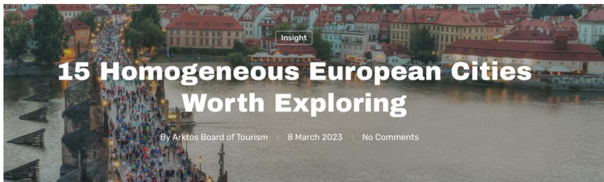
BILDE1: SKJERMDUMP AV FØRSTE ARTIKKELOVERSKRIFT HENTET FRA ARKTOS MEDIAS NETTSIDE

utgitt på den oppdaterte nettsiden var en reiseguide over de 15 mest homogene byene i Europa, og reiseguiden ga en beskrivelse og skildring over hva man kan forvente i de ulike byene og hva som var verdt å få med seg, samt også hvilke etniske grupper som var synlige i bybildet og hvor stor del av befolkningen som er etniske europeiske. Denne artikkelen ble publisert 8. mars 2023, og der det innledningsvis ble lagt frem at denne artikkelen var for de turistene som ønsket å besøke steder og byer i Europa som ikke er preket av multietnisitet og multikulturalitet, men heller gir et innblikk i et mer homogent og autentisk byliv med lav kriminalitet.