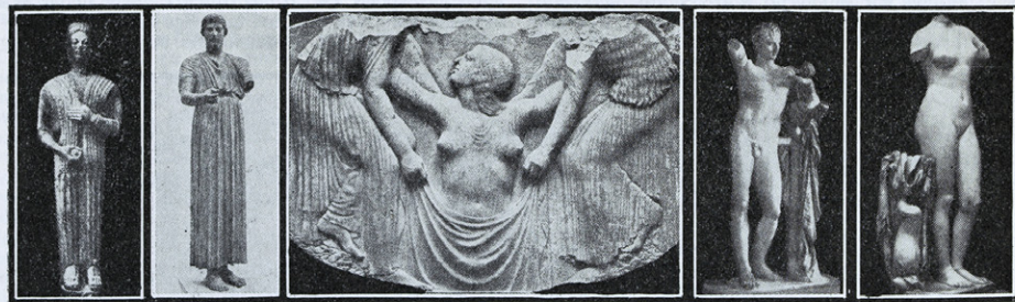
Fra venstre: 13. Gudinne i marmor (ca. 580 f. Kr.). 14. Vogsføreren fra Delfoi (474 f. Kr.), bronse. 15. Afrodite stiger op av havet, marmor (ca. 470 f. Kr.). 16. Marmorstatue av Hermes (ca. 340 f. Kr.). 17. Afrodite-statue i marmor fra Kyrene (ca. 300 f. Kr.).