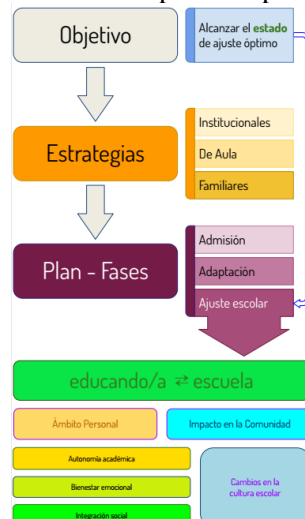
Gráfica 2. Mapa conceptual

Por otro lado, se abre la puerta a profundizar en las estrategias para intervenir en dichos procesos, con objeto de mejorar la información suministrada al grupo IAP y, por tanto, a tratar de conocer cuáles son los constructos ambientales y personales más relevantes de cara a optimizar dichas estrategias.