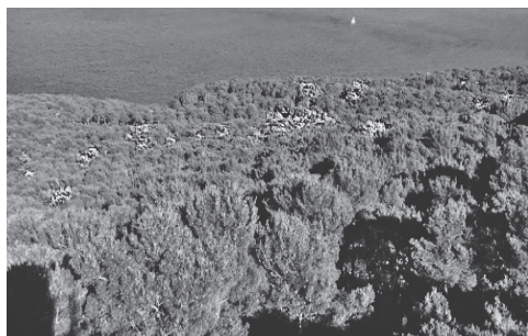
Slika 2. Sušenje bora na Marjanu 2016. godine Figure 2. Drying of pine trees on Marjan in 2016