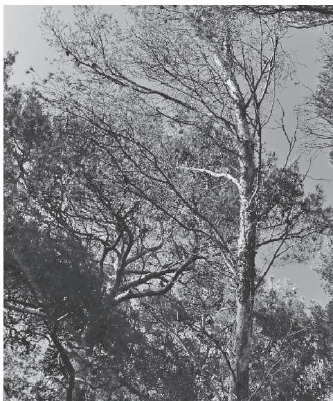
Slika 9. Stablo bez zelenih dijelova krošnje, suhe kore – nije prioritet rušenja Figure 9. The tree without green crown parts and with dry bark- not the priority for the cutting