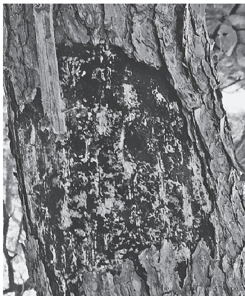
Slika 10. Stablo iz kojeg su izišli potkornjaci – nije prioritet rušenja Figure 10. The tree from which the bark beetles emerged-not the priority for the cutting