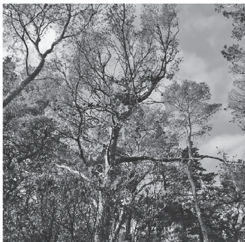
Slika 5. Primjer još uvijek zelene krošnje stabla zaražena potkornjacima Figure 5. An example of still green canopy of trees infested by bark beetles