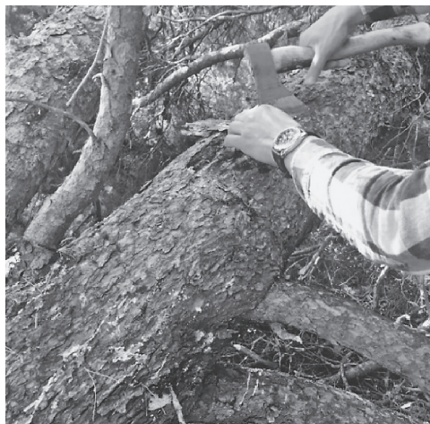
Slika 8. Stablo P1 s potkornjakom Orthotomicus erosus u krošnji Figure 8. Tree P1 with bark beetle Orthotomicus erosus in tree canopy

jedinki potkornjaka. Ispunjeni hodnici tamnom piljevinom s visokom vlagom (Slika 10) znak su da to stablo više nije zarazno. Isto tako, potpuno suha kora koja se teško odvajava od drveta ili otpala kora znak je da stablo ne predstavlja rizik.