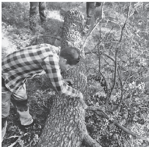
Slika 7. Stablo P1 bez potkornjaka Orthotomicus erosus u deblu sve do krošnje Figure 7. Tree P1 without bark beetle Orthotomicus erosus in the trunk up to the crown