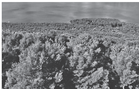
Slika 3. Sušenje bora na Marjanu 2017. godine Figure 3. Drying of pine trees on Marjan in 2017

intenzitet se sušenja povećao te se počinju uočavati krugovi suhih stabala (Slika 3), što je tipičan obrazac kod napada potkornjaka, kakav je poznat za, naprimjer, smrekovog potkornjaka ( Ips typographus ) ili borovog srčikara ( Tomicus destruens ) (Franjević i dr. 2012).