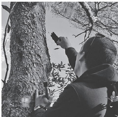
Slika 6. Hodnici potkornjaka na 6m visine, donji dio do 6m služi kao lovno stablo Figure 6. Bark beetle galleries at 6 m height, lower part up to 6 m serves as trap tree