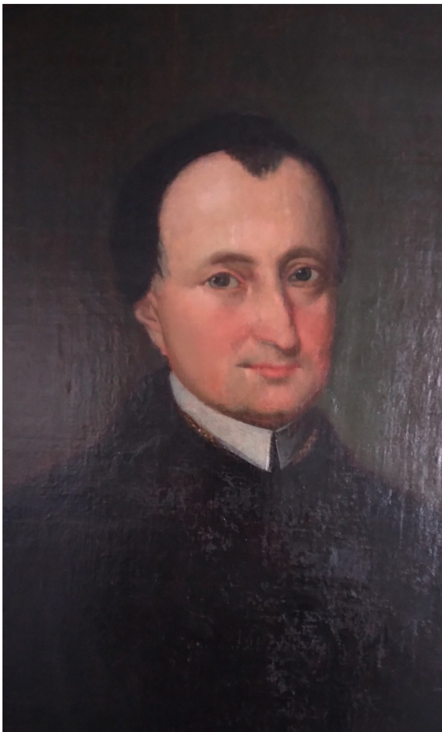
Obr. č. 1: Portrét Jakuba Chmela, detail anonymní olejomalby vzniklé pravděpodobně za Chmelova života, Benediktinské arcidiocesi Praha-Břevnov; foto © Benediktinské arcidiocesi Praha-Břevnov (Ondřej Koupil), 2023.