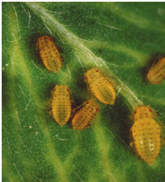
Fig. 1. Therioaphis macculata sur une feuille de luzerne. Noter la perte de chlorophylle le long des nervures. Il suffit d'une infestation modérée pour provoquer la mort de la plante.

insectes. Ainsi, lorsque les feuilles de cotonnier sont attaquées par des larves de Spodoptera exigua Hübner, elles libèrent dans l'environnement des substances volatiles [11]. Il s'agit de l'indole, de terpènes (monoterpènes, sesquiterpènes, homoterpènes) et de petites molécules (hexenals, hexenols, acétate d'hexényle) provenant du clivage de l'acide linoléique. Ces substances volatiles se comportent comme des signaux guidant des hyménoptères parasites vers les chenilles de S. exigua , dans lesquelles ils pondent leurs œufs. La production de ces substances est provoquée par des éliciteurs présents dans la salive du lépidoptère, tout particulièrement la volicitine. Notons que la volicitine est un conjugué formé par la chenille résultant de l'addition de glutamine (et d'un groupement hydroxyle) à l'acide linoléique provenant de l'hôte. Par conséquent, l'impact de l'acide linoléique est complexe : d'une part, il compte parmi les nutriments essentiels à de nombreuses larves de lépidoptères, mais, d'autre part, il contribue à limiter leur nombre.