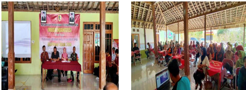
Gambar 1 Musrembangdes 2019

“Pertama ada TPK dari pemerintah desa, Kepala desa serta perangkat, lalu LPM dan BPD juga tokoh-tokoh masyarakat”(Widodo, 2020).