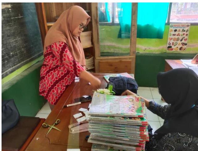
Gambar 6. Pelaksanaan Penataan Pojok Literasi

dimasing-masing kelas ditata semenarik mungkin. Kegiatan penataan pojok literasi di masing-masing kelas dapat dilihat pada Gambar 6.