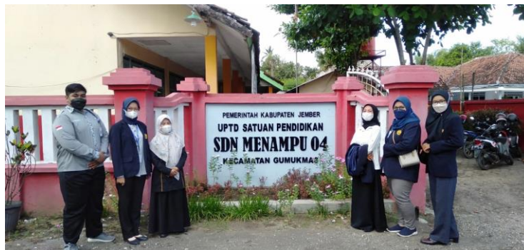
Gambar 2. Tampak depan SDN Menampu 04 Jember

SDN Menampu 04 Jember berada di Kecamatan Gumuk Mas Kabupaten Jember dengan jarak 50 KM dengan jarak tempuh 1,5 jam. Gambar 2 menunjukkan tampilan tampak depan dari SDN Menampu 04 Jember.