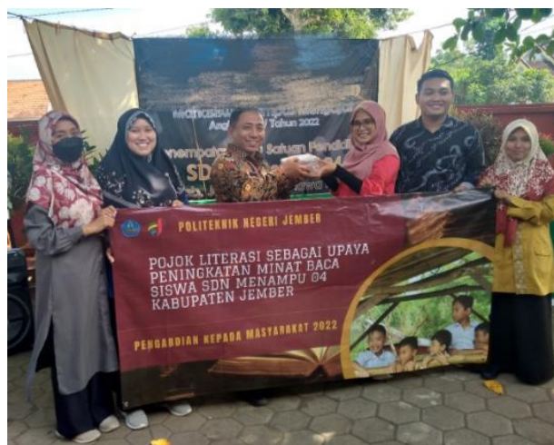
Gambar 5. Penyerahan Buku Kepada Kepala Sekolah SDN Menampu 04

Ketersediaan buku di SDN Menampu 04 semakin banyak, baik buku fiksi maupun non fiksi. Penambahan buku fiksi sebanyak 61 buku dan buku non fiksi sebanyak 42 buku. Dari 123 buku yang ada di pojok literasi, berasal dari 19 penerbit yaitu Gramedia, Elex Media, Tiga Lancar Semesta, Gagas Media, Apollo L, Bengawan Ilmu, Bentang Pustaka, Bintang Indonesia, Beringin SS, Buana Raya, Pamularsih, Dee Publishing, Dua Media, Empat Pilar, Farhas Surabaya, Lintas Media, Pustaka Agung, Serba Jaya Surabaya, dan Sindur Press. Penyerahan buku dari tim pengabdian kepada SDN Menampu 04 diwakili oleh kepala sekolah seperti yang ditunjukkan pada Gambar 5.