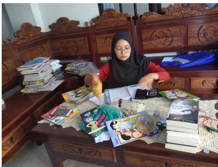
Gambar 3. Pembagian Penambahan Buku Pada Masing-Masing Kelas

Selain diadakan pojok literasi di masing-masing kelas, ketersediaan dari buku juga harus diperhatikan. Buku yang disediakan disesuaikan dengan kebutuhan siswa. Jenis buku baik fiksi maupun non fiksi juga harus dipertimbangkan dengan baik. Tidak hanya itu, bahasa dari buku yang tersedia juga harus diperhatikan. Tidak hanya buku berbahasa Indonesia, namun juga bahasa Inggris, bahkan juga bahasa daerah. Kegiatan perencanaan dan pembagian buku di masing-masing kelas dapat dilihat pada Gambar 3.