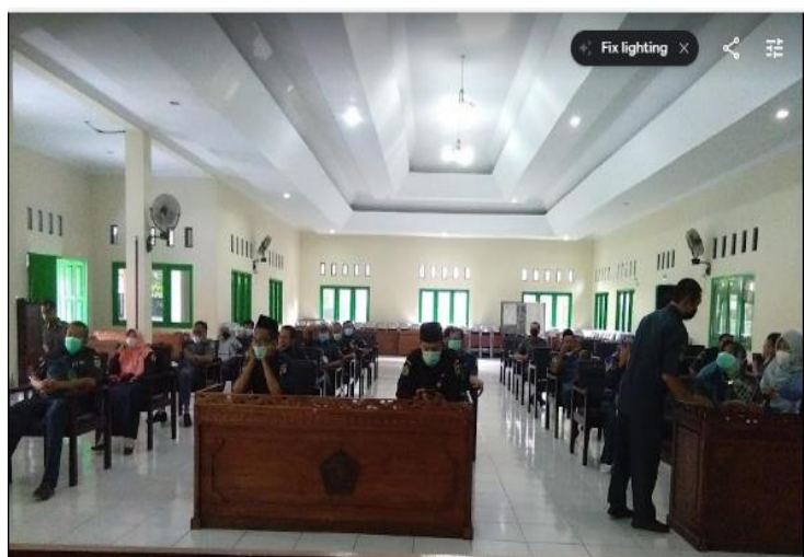
Gambar 3. Peserta Pelatihan Pembuatan Video

Sedangkan, Gambar 3 berikut ini menunjukkan peserta yang menghadiri kegiatan pelatihan pembuatan video :