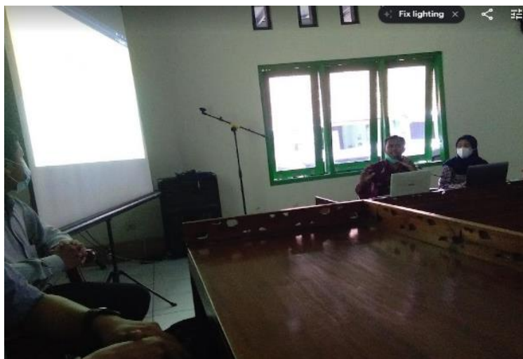
Gambar 2. Pelaksanaan Pelatihan Pembuatan Video

Kegiatan ini diikuti sebanyak 40 guru dari MIN 1 Klaten, guru-guru ini berasal dari seluruh kelas yang ada di MIN Klaten, baik guru mata pelajaran maupun guru kelas. Adapun pada staff juga mengikuti kegiatan ini untuk menambah pengetahuan di bidang pendidikan khususnya pembuatan video informasi kepada siswa.