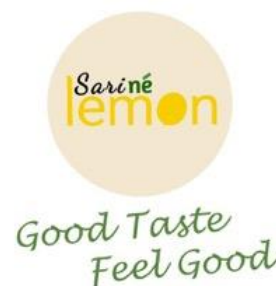
Gambar 4. Logo dan Tagline Sari Ne Lemon

Desain logo dibuat berdasarkan kebutuhan dan deskripsi yang telah didapatkan sebelumnya maka berikut adalah hasil desain logo kemasan dan tagline “ Good Taste, Feel Good ” dapat dilihat pada gambar 4 dibawah ini