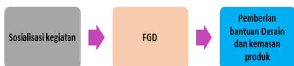
Gambar 3. Gambaran Umum Kegiatan

Berikut adalah gambaran umum kegiatan yang telah dilakukan pada industri rumah tangga/ UMKM Sari Ne Lemon pada gambar 3.