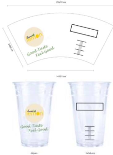
Gambar 5. Desain Implementasi Logo Pada Cup 400 ml

Implementasi hasil desain logo dan Tagline dari produk baru UKM Sari ne Lemon yaitu Sparkling Lemon dengan ditempatkan pada kemasan cup plastic ukuran 400 ml dapat dilihat pada gambar 5.