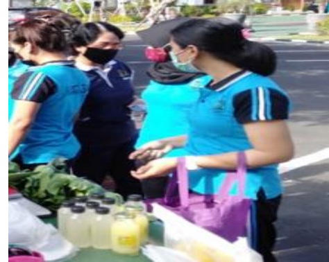
Gambar 1. Perasan Lemon Dijual Pada Pasar Umum

botol namun tanpa label dan terlihat kurang menarik (Apriyanti, 2018). Padahal sebuah kemasan sangat menentukan jumlah produk yang dapat terjual (Purnaningrum, 2018).