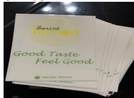
Gambar 7. Label Baru Sari Ne Lemon

Pada tahap ini tim pengabdian masyarakat ITB Stikom Bali memberikan label Sari Ne Lemon yang telah didesain dan dicetak sebanyak 200 buah beserta gelas cup plastik sebanyak 200 buah kepada mitra. Dalam tahap ini, tim pengabdian masyarakat mengajak mitra untuk berlatih dalam pemasangan label Sari Ne Lemon yang baru pada gelas cup plastik.