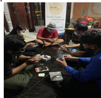
Gambar 8. Pelatihan Pemasangan Label pada Gelas Cup Plastik

Pelatihan pemasangan label baru digunakan dengan mendatangi dan melatih mitra secara langsung dengan menerapkan protokol kesehatan.