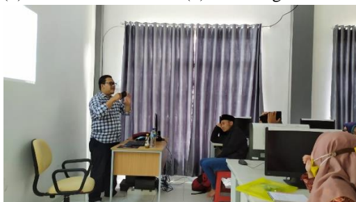
Gambar 2. Pelatihan Hari Pertama

Aktivitas pelatihan dilaksanakan dalam waktu tiga hari dengan materi tentang teknik pengambilan gambar yang meliputi: (1) pengaturan angle , (2) komposisi, (3) frame size , dan (4) type of shot . Sedangkan materi di hari kedua berisikan tentang teknik editing yang meliputi: (1) pengenalan software Adobe premiere , (2) tool memilih sequence , (3) menata video di timeline , (4) cut and transition , serta (5) color grading . Pada hari terakhir, ditambahkan materi mengenai: (1) menambah musik, (2) menambah teks dan (3) rendering .