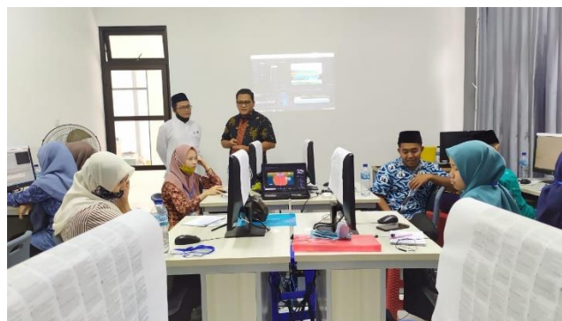
Gambar 3. Pelatihan Hari Kedua

Hasil dari hari kedua dan ketiga juga membuktikan bahwa para peserta yang seluruhnya merupakan alumni dari SMK dan SMA mampu mengeluarkan potensi kreatifitas yang selama ini tidak mereka ketahui. Sehingga mampu membangkitkan kepercayaan diri dalam mengembangkan diri di kemudian hari dan bersaing di dunia kerja.