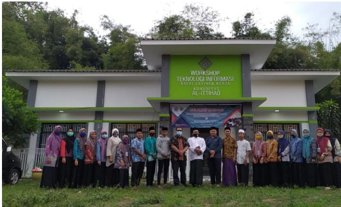
Gambar 4. Pelatihan Hari Terakhir

Hasil dari pengerjaan proyek para peserta ini, meski tidak bisa dikatakan sempurna, menjadi titik awal dari pengembangan diri yang diharapkan oleh pengelola BLK bagi para peserta belajar. Sehingga di kemudian hari muncul semangat untuk tetap belajar meskipun sudah tidak lagi di jalur pendidikan formal.