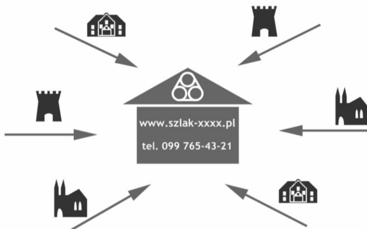
Rys. 6. Kryterium koordynacji (opr. A. Mikos von Rohrscheidt, O. Artyschuk)

taki podmiot, dla którego koordynacja szlaku jest zadaniem zarówno wyłącznym, jak i głównym lub też tylko dodatkowym zadaniem zleconym (np. regionalna lub lokalna placówka informacji turystycznej).