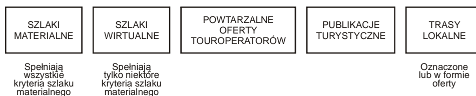
Rys. 1. Podział szlaków turystyczno-kulturowych (Mikos von Rohrscheidt 2008)

Przedstawiony przez autora w cytowanej już publikacji (Mikos von Rohrscheidt 2008) dodatkowy podział szlaków turystyczno-kulturowych, obejmuje dwie zasadnicze kategorie: szlaki materialne i szlaki wirtu-