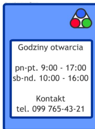
Rys. 4. Kryterium dostępności (opr. A. Mikos von Rohrscheidt, O. Artyschuk)

Omawiany warunek dostępności nie posiada jednak charakteru absolutnego – nie chodzi w nim o faktycznie stałe czy całodzienne otwarcie każdego obiektu. W przypadku obiektów mniejszych lub rzadziej odwiedzanych wystarczy zapewnienie możliwości ich udostępnienia na życzenie turystów codziennie lub niemal codziennie w wyznaczonych godzinach, np. w postaci „klucz na telefon” – również jeśli miałyby się to wiązać z koniecznością dodatkowej opłaty dla personelu opiekującego się obiektem, jednakże według ustalonego cennika. Jasno określone zasady udostępniania mniejszych lub położonych z dala od miejskich ośrodków obiektów (jak np. zabytkowych kościołów, małych wiejskich muzeów, licznych cennych budowli bez stałej opieki na miejscu) zredukują częste na polskiej prowincji przypadki traktowania turystów jak intruzów lub żądania od nich samowolnie ustalanych opłat, na które nie są przygotowani.