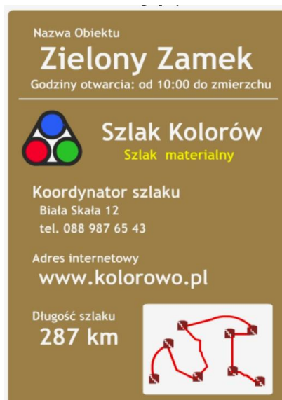
Rys. 3. Przykład tablicy informacyjnej szlaku materialnego przy obiekcie (opr. A. Mikos von Rohrscheidt, O. Artyschuk)