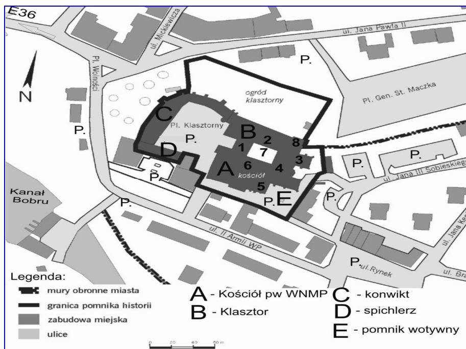
Rys. 1. Plan zespołu poaugustiańskiego w Żaganiu

problem stanowi także zły stan murów klasztornych, które pękają pod wpływem wilgoci. Z kolei obiekty konwiktu i spichlerza wymagają generalnego remontu więźby i pokrycia dachowego, a także elewacji. W rezultacie ich wygląd budzi zastrzeżenia i stwarza wrażenie zaniedbania.