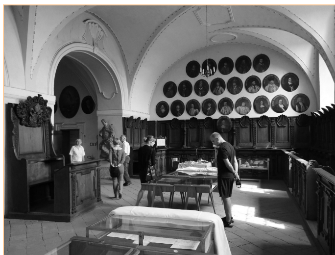
Fot. 4. Fragment ekspozycji muzealnej urządzonej w emporyze chóru kościoła, w głębi stanowisko sprzedaży biletów i publikacji poświęconych zespołowi klasztornemu (autor: M. Duda-Seifert)

We wschodniej części górnego piętra znajduje się wejście do słynnej biblioteki utworzonej w XIV w., a przebudowanej w 1730 r. w stylu barokowym (HACZKIEWICZ 2003, KOWALSKI 1999c). Ówczesny opat zarządził montaż metalowych okiennic i kutych drzwi bogato zdobionych, a następnie sklepienia pomieszczenia upiększył dwoma polichromiami malarz śląski Georg Wilhelm Joseph Neunhertz (ŚWIERK 1965). Charakterystyczną częścią biblioteki jest posadzka, która spełnia funkcję „klimatyzacji”. Między piaszkowymi płytkami wmontowano drewniane klepki, które stabilizowały temperaturę i ściągały mikroorganizmy ze starodruków i książek (fot. 3). Wnętrze słynie także ze znakomitej akustyki dzięki specjalnie ukształtowanemu sklepieniu, tzw. szeptanemu. Znajdują się tu dwa globusy z 1640 r., pochodzące z niderlandzkiego warsztatu G. Bleau (HACZKIEWICZ 2003). Obok biblioteki jest położony górny chór, który posiada połączenie wewnętrzną klatką schodową z prezbiterium na parterze. Obecnie funkcjonuje tu muzeum z wieloma cennymi eksponatami, m.in. dwoma bogato rzeźbionymi i złożonymi barokowymi relikwiarzami ze zwłokami świętych męczenników: Krystiana i Teodata, stylowym konfesjonalem i szatami liturgicznymi (fot. 4). W zabudowie klasztornej znajduje się również korytarz zachodni z piaszczową dekoracją portalu z 1771 r.