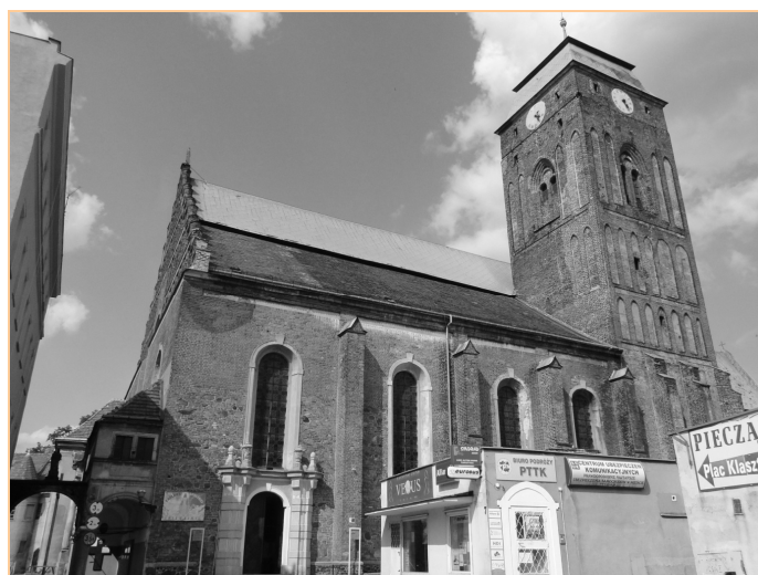
Fot. 2. Widok kościoła pw. Wniebowzięcia Najświętszej Marii Panny w Żaganie od strony południowej; po lewej brama prowadząca na plac Klasztorny, na wprost boczne wejście do świątyni, po obu stronach portalu tablice informacyjne miejskiego Szlaku Książęcego; na pierwszym planie zabudowa powojenna