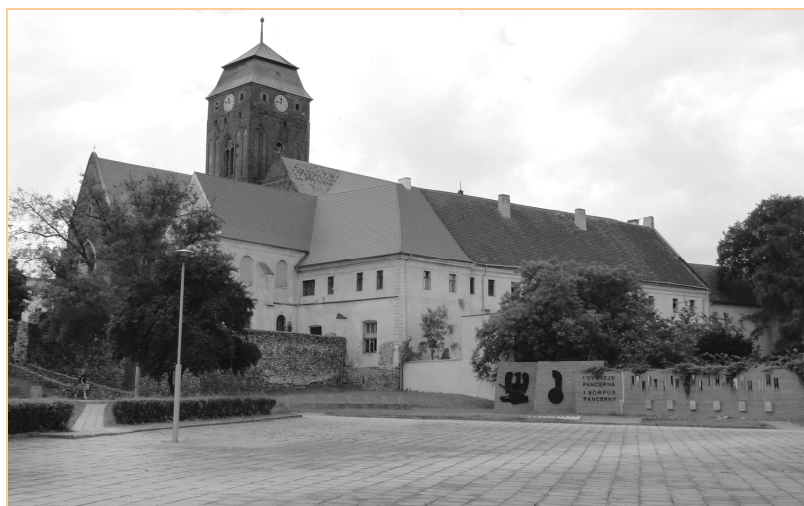
Fot. 1. Widok zespołu poagustiańskiego w Żaganiu od strony północno-wschodniej; na wprost widoczny północno-wschodni narożny budynek klasztoru wzniesiony na miejscu pierwszego zamku książąt żagańskich, na lewo od niego kaplica św. Anny, a nad nią biblioteka, na prawo – północne skrzydło klasztoru, zbudowane zgodnie z linią murów miejskich, częściowo przesłonięte ogrodem, nad całością góruje wieża kościoła pw. Wniebowzięcia NMP (autor: M. Duda-Seifert)

Klasztor Augustianów w Żaganiu ma ogromną wartość ze względu na walory artystyczne. Kompleks ten powstał w wyniku działań twórczych budowniczych i artystów z różnych epok. Stanowi świadectwo nawarstwiania stylów, poczynając od śladów romańskich, poprzez gotyckie sklepienia i renesansowy krużganek, aż po ostateczną przebudowę w stylu baroku (KOWALSKI 1999c, PERYT-GIERASIMCZUK 1999) (fot. 1).