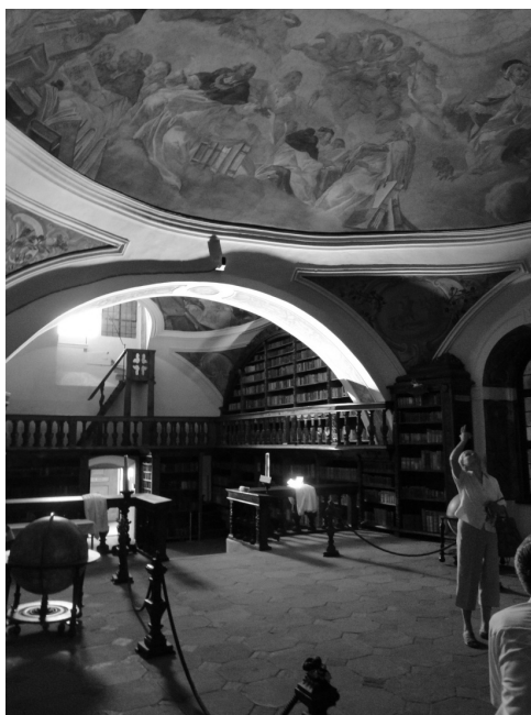
Fot. 3. Wnętrze biblioteki poaugustiańskiej w Żaganiu (autor: M. Duda-Seifert)

Podobnie romańskie, gotyckie i renesansowe elementy architektoniczne, barokowe polichromie oraz wyposażenie wnętrz decydują o wysokiej wartości artystycznej pozostałych obiektów poklasztornych. W XIV w. budynki otrzymane od księcia zostały przebudowane, obejmując refektarz, kuchnię letnią, zimową i dom opata, a których mury obecnie znajdują się na poziomie piwnic. Po wielkim pożarze w 1730 r. przebudował klasztor w duchu baroku legnicki architekt Martin Frantz (KOWALSKI 1999b). Wschodnia część klasztoru posiada relikty architektury gotyckiej, w tym m.in. kamienne epitafia opatów. Ze wschodniego korytarza klasztoru można dostać się do gotyckiej kaplicy zakonnej pw. św. Anny z XVI w., z barokowymi ołtarzem i emporą muzyczną z dziewiętnastowiecznym instrumentem organowym (ADAMEK, ŚWIĄTEK 2002). Korytarz północny zawiera polichromie barokowe przedstawiające 23 wizerunki opatów. Łączy się on z tzw. Salą Opacką, która służyła jako kapitułarz, udekorowaną w stylu rokokowym i posiadającą wizerunki przeorów na sklepieniu. Z korytarza północnego klatką schodową bogato zdobioną freskami barokowymi można przedostać się na piętro, upiękkszzone freskami z XVIII w.