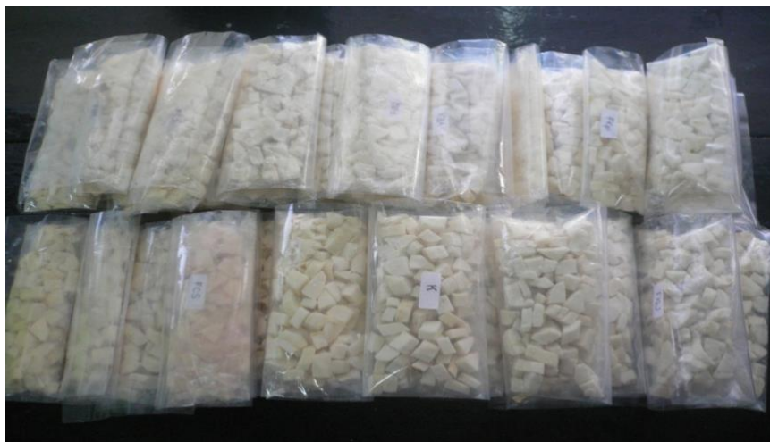
Gambar 2. Produk “Wikau Maombo” hasil fermentasi isolat mikroorganisme lokal

Produk “Wikau Maombo” berkualitas baik dari hasil fermentasi isolat bakteri yaitu produk FM , hasil fermentasi isolat kapang yaitu FKpC dan hasil fermentasi isolat khamir yaitu FHC.