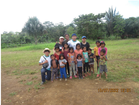
Figura 6. Visita comunidades aledañas

yuca tan típica de allí. Durante estas visitas también se compartió con los pequeños, motivo muy importante de nuestra gestión, haciendo algunos juegos y dinámicas de diferentes tipos, compartiendo así un poco de felicidad con ellos mientras demostrábamos los valores que como salesianos nos caracteriza y nos mueve en cada momento.