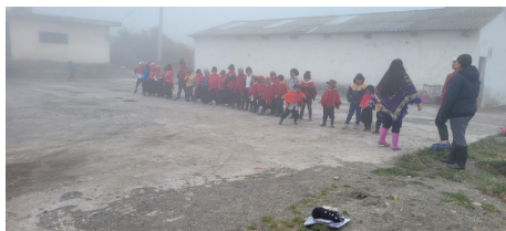
Figura 8. Oratorio Festivo

Algo muy importante a detallar en esta comunidad, es que al estar ubicada en la zona Norte hacía demasiado frío y en muchos casos impedía estar en ciertas horas del día con las personas de la comunidad o se dificultaba mucho poder visualizar a todos los niños, generalmente al caer la tarde nos cubría una neblina muy densa que en ocasiones dificultaba un buen desarrollo de las actividades.