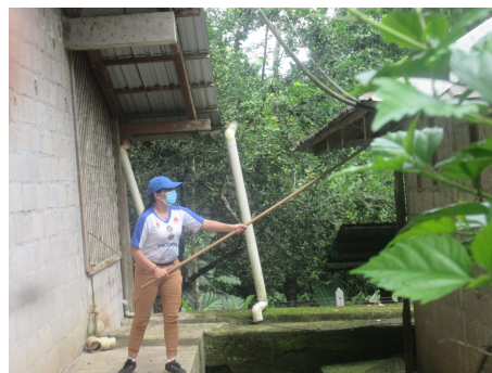
Figura 4. Mantenimiento en lugar de trabajo

un poco deterioradas y podrían representar un peligro para los salesianos, niños, niñas y adolescentes que suelen encontrarse en las tardes ahí. Fue un trabajo que nos tomó varios días, pero se logró acabar en el tiempo previsto y culminar con éxito la misión y conquistando nuestro objetivo [1].