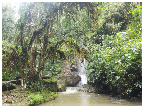
Figura 3. Cascada (Kupiamais)

Esta experiencia marcó un nutritivo crecimiento personal, en especial por aprender a valorar el país en donde vivimos, lleno de encanto y majestuosidad. Además de ello, fue muy importante el respetar la riqueza de la cultura shuar, ya que al estar fuertemente arraigados a ellas nos hacían ver el mundo de otra manera y ser parte de su convivir ancestral.