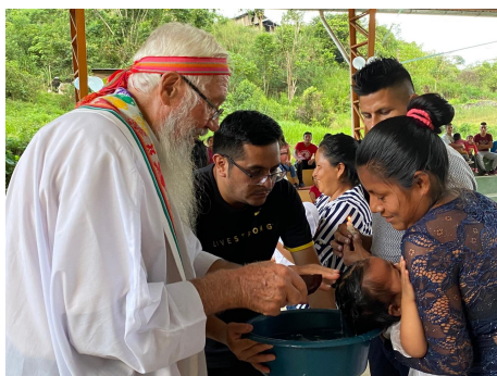
Figura 1. Celebraciones eucarísticas

Esta colectividad tiene una cultura netamente shuar y muchos de sus habitantes reconocen las celebraciones religiosas solo en su propio idioma, además algo característico de esta es que se encuentra a dos horas de caminata desde la Misión, pues así se identifica a la comunidad salesiana de Bomboiza, por lo que es de difícil acceso; sin embargo, esconde grandes sorpresas en lo natural y espiritual [1].