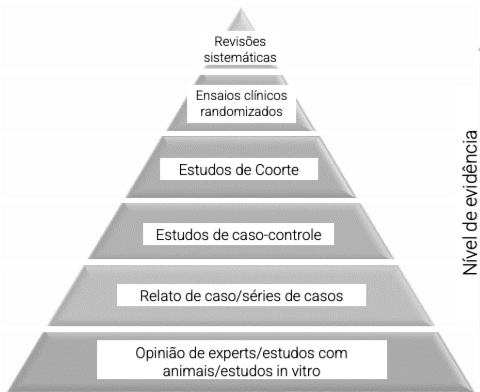
Figura 1. Pirâmide de Evidências.

Os estudos científicos utilizados para se colocar em prática a medicina baseada em evidências podem ser classificados de acordo com a sua qualidade metodológica, na forma de uma pirâmide. Os desenhos de estudo que se encontram na parte superior da pirâmide apresentam melhor qualidade metodológica e maior nível de evidência científica, enquanto aqueles que estão na base da pirâmide apresentam menor nível de evidência (figura 1).