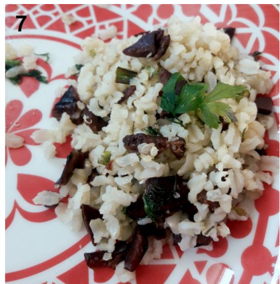
Figura 6. Basidiomas de Phlebopus cf. portentosum (Berk. & Broome) Boedijn à venda em um mercado público de Kunming, Yunnan, China. Fig. 7. Risoto preparado com o cogumelo brasileiro Phlebopus beniensis (Singer & Digilio) Heinem. & Rammeloo.