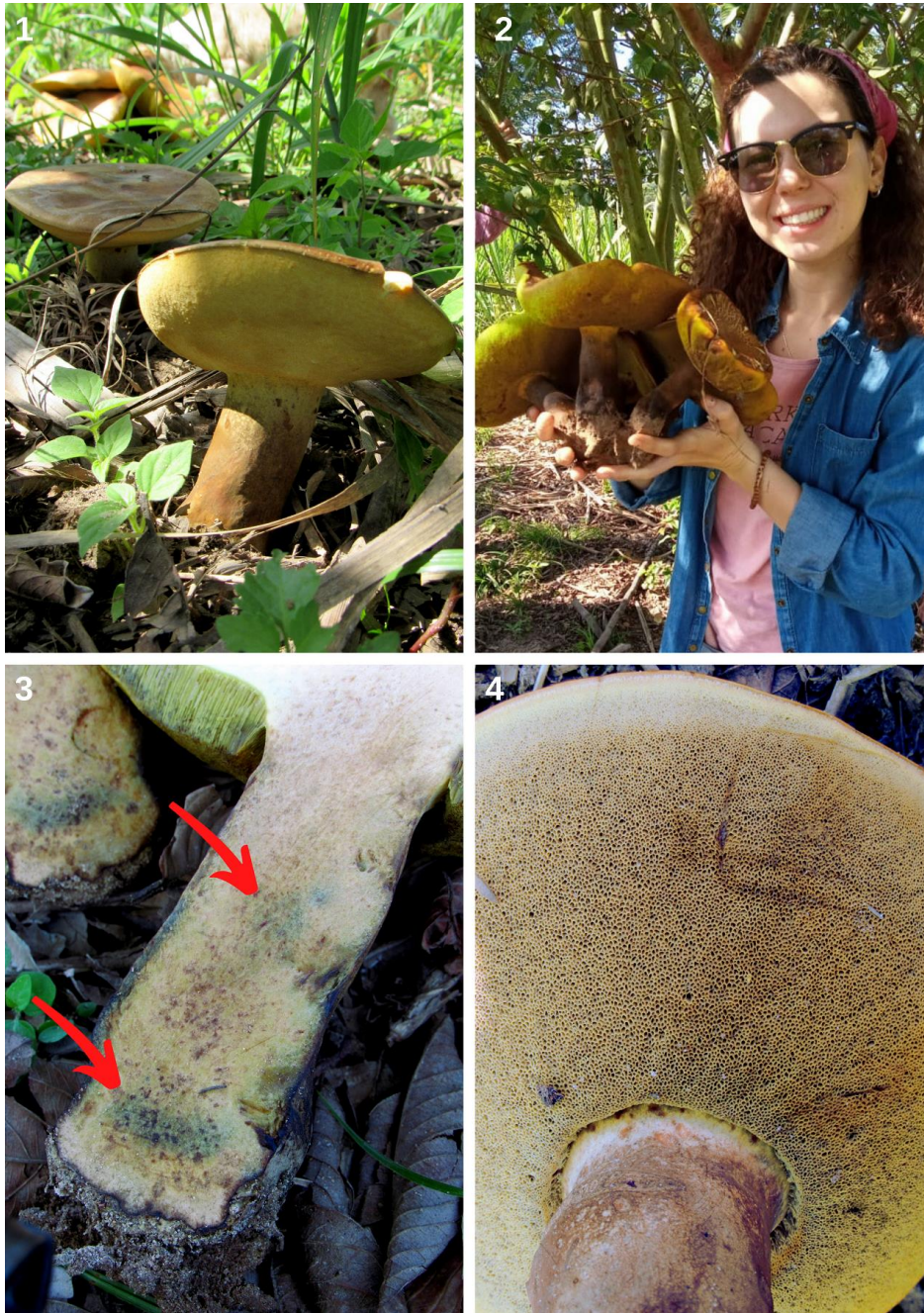
Figuras 1-4. Phlebopus beniensis (Singer & Digilio) Heinem. & Rammeloo. 1. Basidiomas in situ . 2. Basidiomas ex situ . 3. Corte do estipe mostrando regiões do contexto com azulamento (setas). 4. Detalhe do himenóforo poroide. Figures 1-4. Phlebopus beniensis (Singer & Digilio) Heinem. & Rammeloo. 1. Basidiomes in situ . 2. Basidiomes ex situ . 3. Stipe section showing context with blue patches (arrows). 4. Poroid hymenophore detail.