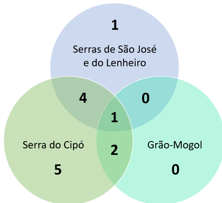
Figura 2. Diagrama de Venn demonstrando as relações entre as Serras de São José e do Lenheiro, Serra do Cipó e Grão-Mogol, Estado de Minas Gerais, Brasil, segundo a composição de espécies da família Orobanchaceae de cada uma das áreas.