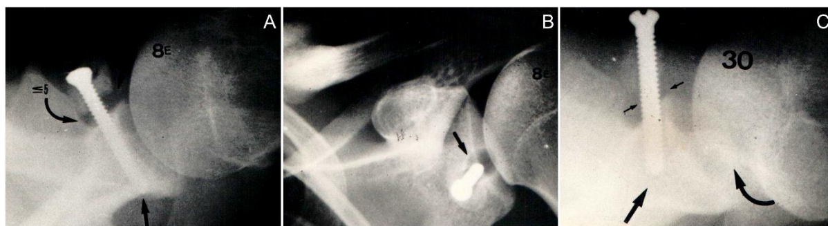
Figura 4. Complicações cirúrgicas. A: ausência de consolidação; B: osteólise ao redor do parafuso; C: deslocamento do parafuso.