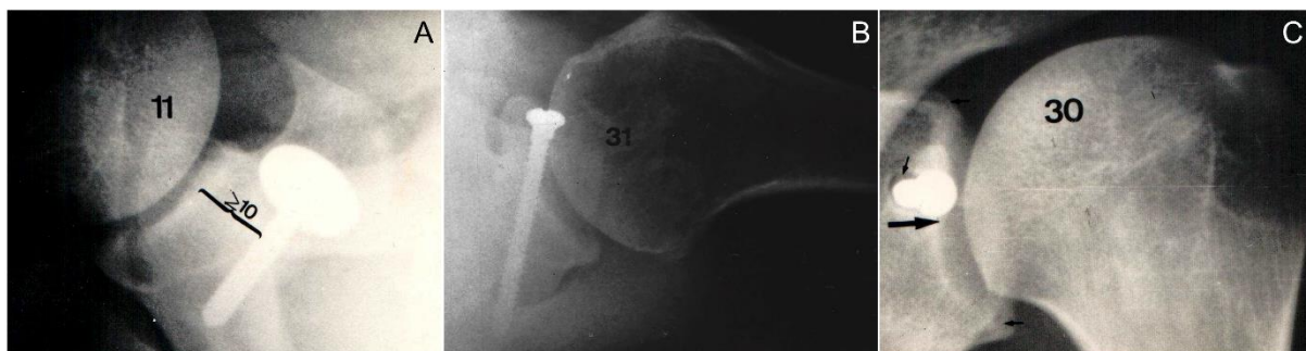
Figura 3. Erros de técnica cirúrgica: A: enxerto medializado; B: parafuso oblíquo e longo; C: enxerto posicionado acima do equador da glenoide.