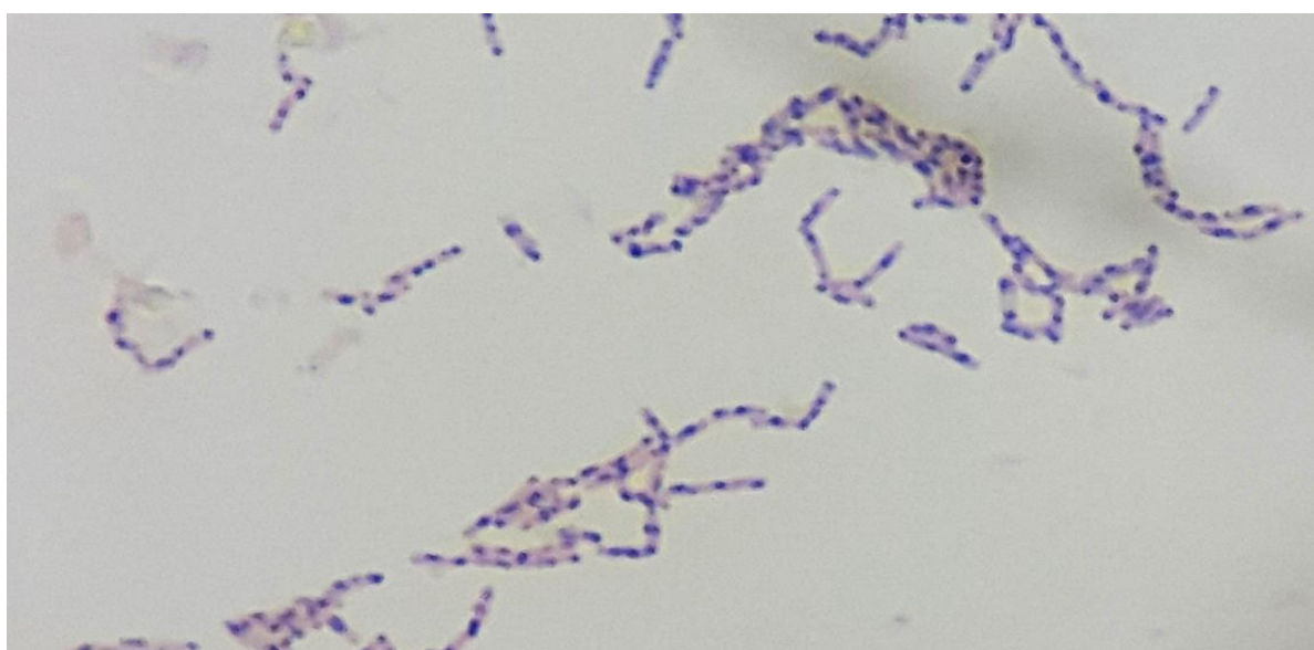
Figura 1. Gránulos de PHA en bacterias Gram negativas.

En el proceso fermentativo, la absorbancia de la biomasa de Azospirillum sp. 130 osciló entre 0,06 y 0,1 en el medio balanceado, así como 0,07 y 0,13 en el medio desbalanceado valores correspondientes a 0,03 a 0,23 g/L y 0,06 a 0,30 g/L, respectivamente.