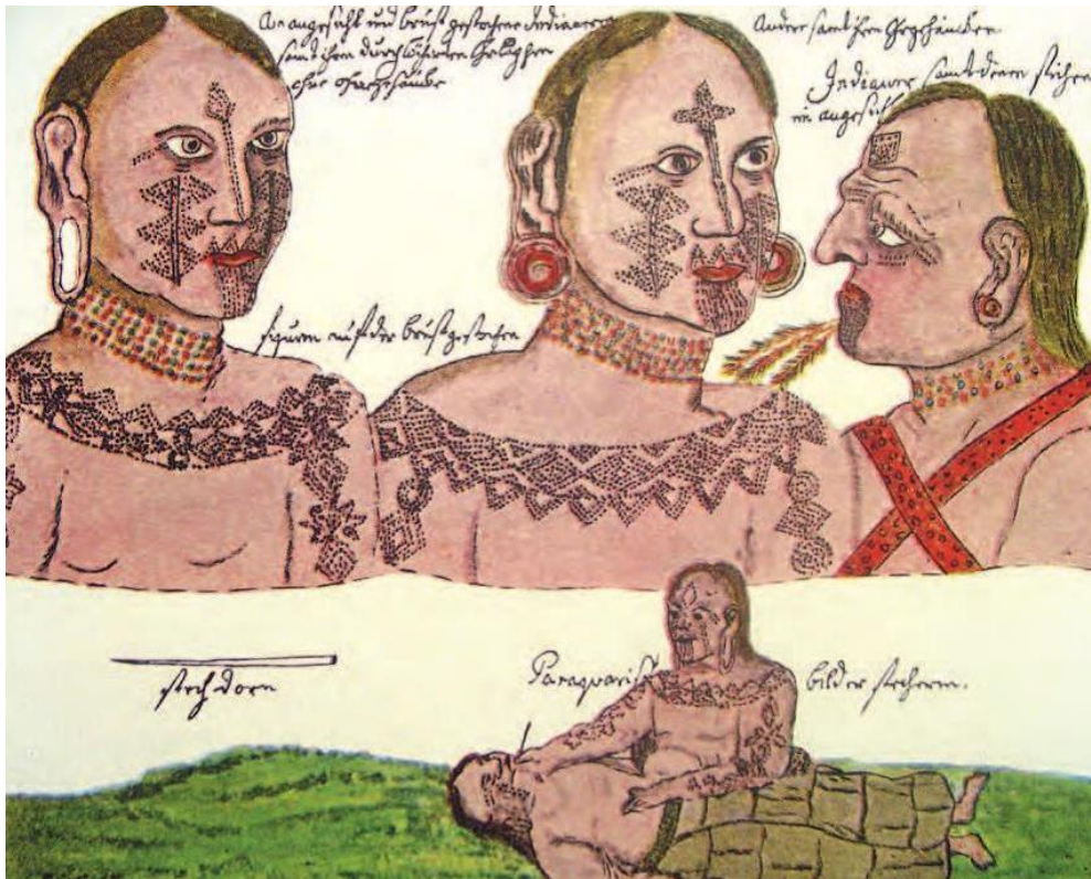
Figura 5. Representación de escarificaciones en el rostro y el cuerpo de los indios Mocoévíes históricos, del Este del Chaco, ilustrada por el Misionero Florián Paucke en el siglo XVIII. Nótese las variaciones individuales (tomado de Paucke, 1943: Lámina XV).

En este sentido, estos artefactos no serían solo representaciones, sino también otras materializaciones concretas por sí mismas, con sus propias capacidades y propiedades materiales.