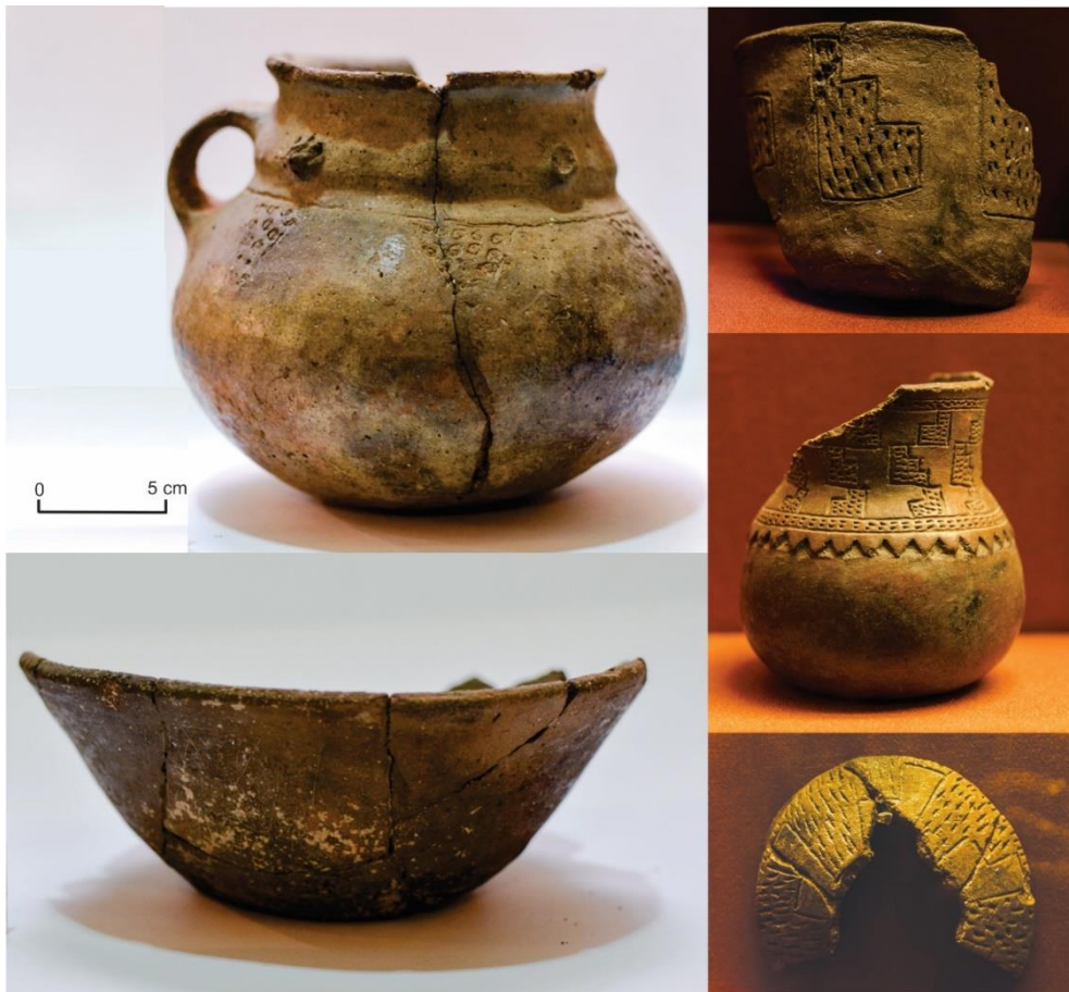
Figura 2. Cerámica con incisiones característica de la región central de la Provincia de Córdoba (Colección del Museo de Antropología de la Universidad Nacional de Córdoba, Argentina).

Un dato que merece atención es el hecho de la baja frecuencia relativa de hallazgos de este tipo de alfarería, ya sea en superficie o en estratigrafía (en excavaciones no supera en promedio el 3,5 % del total). Lo mismo sucede con las incisas con motivos geométricos (Figura 2) o pintadas en rojo sobre el color de la pasta, que tampoco superan el 3% en promedio, en comparación con otras clases lisas ordinarias (las más abundantes). Todas estas últimas parecen haber sido manufacturadas con la técnica tradicional de rodete, sin poder evidenciarse el uso de moldes. Su baja frecuencia nos remite a la idea de que se trataría de una técnica y de un modo de hacer no tan habitual como la producción de las alfarerías lisas.