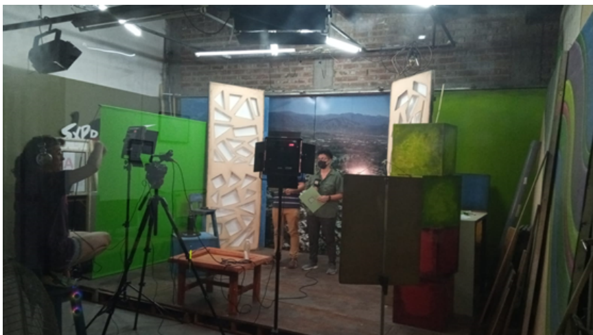
Estudios de Giramundo Tv Comunitaria, noviembre de 2021, Mendoza

Una de esas estrategias fue crear una productora ante la AFSCA y presentarse a los concursos de los Fondos de Fomento Concursable para Medios Audiovisuales Comunitarios (FOMECA) establecidos en el artículo 97 de la ley SCA. Consideramos esta estrategia visibiliza la necesidad de actualización y articulación con las políticas públicas para hacerse lugar en el sistema de medios, el mismo que condiciona “la incorporación de las TIC” (Vinelli, 2017:9). Así, en junio de 2019, Giramundo logró poner al aire la señal digital en el canal 34.1 5 , lo que le permitió ampliar su zona de cobertura en el Gran Mendoza, epicentro urbano y semi-urbano de la provincia con la mayor concentración poblacional 6 .