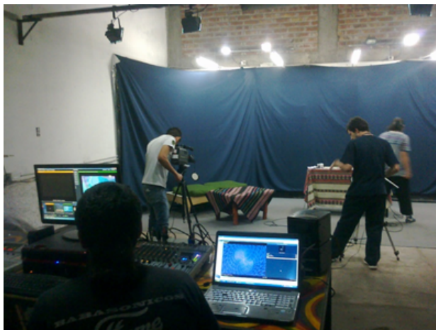
Estudios de Giramundo Tv Comunitaria, Mendoza, 2013.