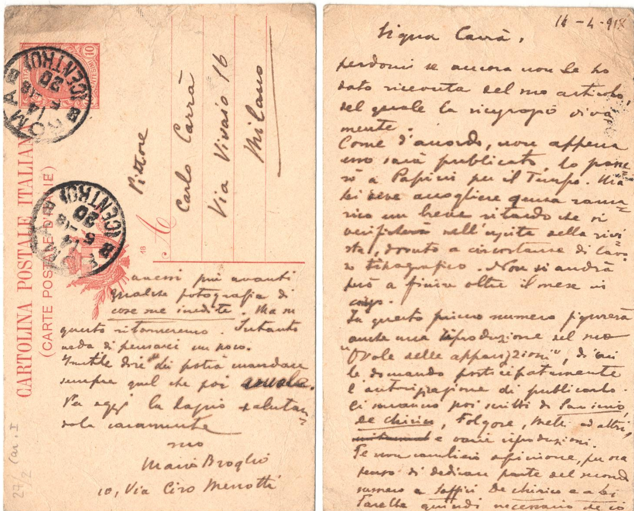
Fig. 2. Mario Broglio a Carlo Carrà (Mart, Archivio del '900, Fondo Carlo Carrà, 1.27/2, 1918 maggio [14], Roma)