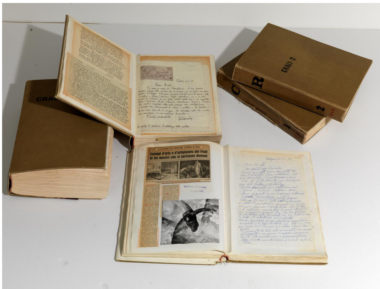
Fig. 4. I libri di Tullio Crali (Mart, Archivio del '900, Fondo Tullio Crali)