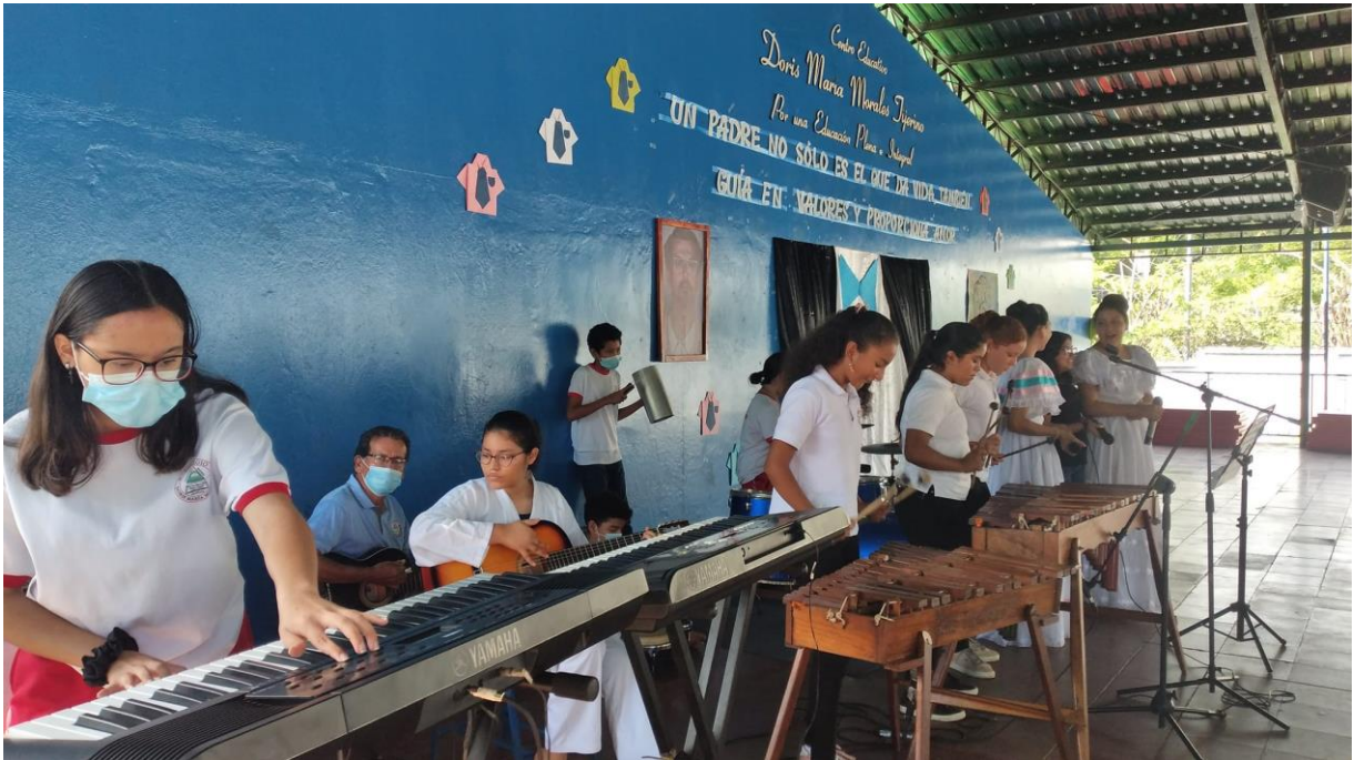
Estudiantes de música del colegio Doris María Morales.