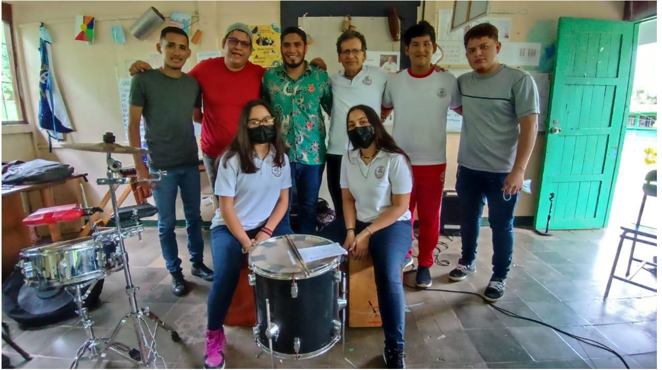
Salón de música del colegio Doris María Morales.