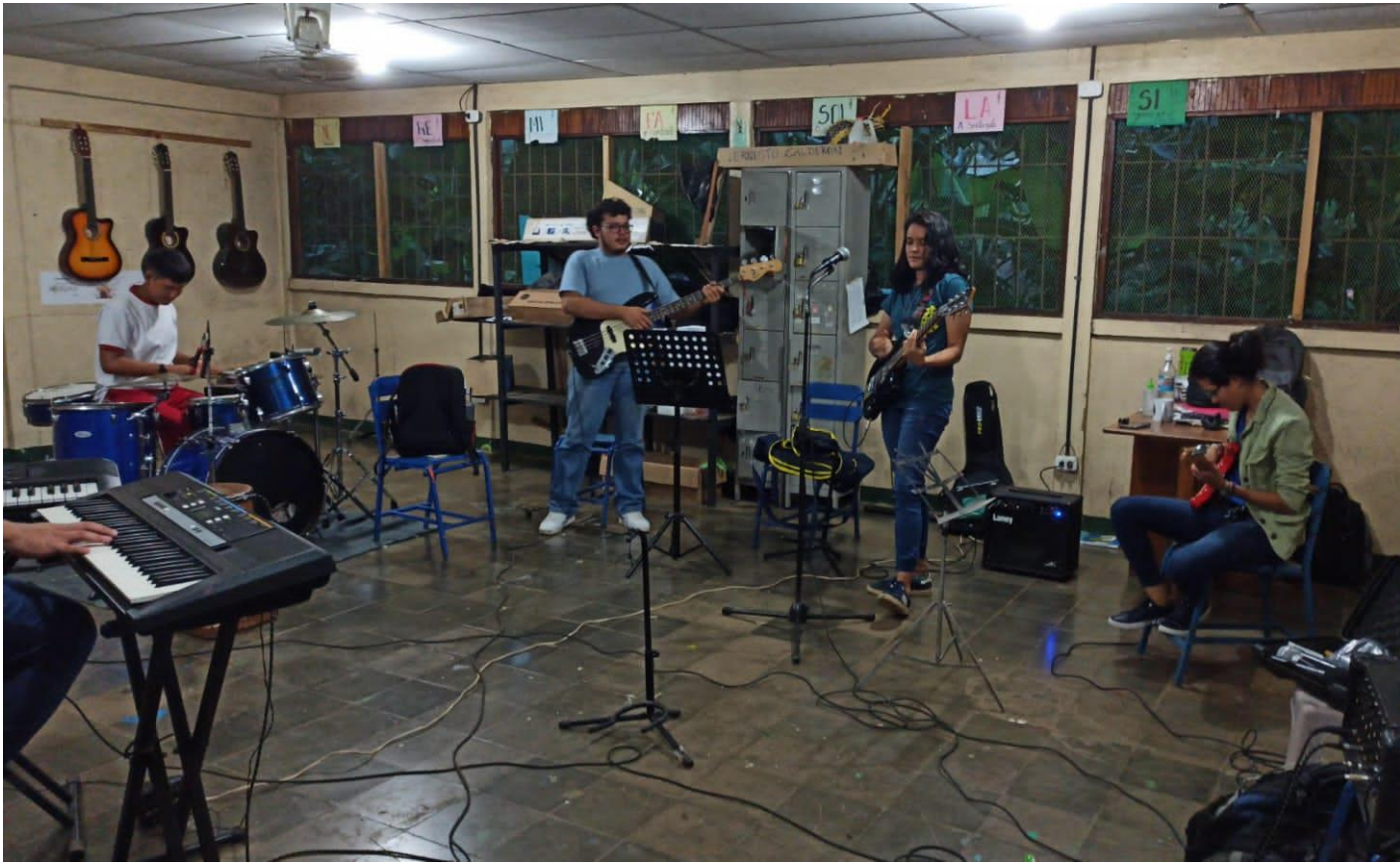
Práctica de conjunto en el aula de música del colegio Doris María Morales