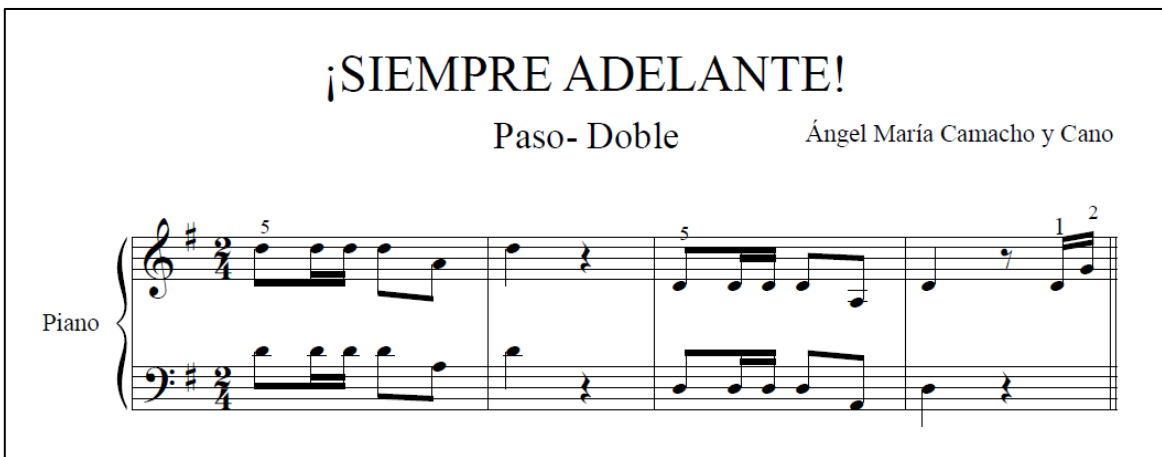
Imagen 1. Pasodoble ¡Siempre adelante!

Fuente. Torreglosa, N. (2014). Obra musical del compositor Ángel María Camacho y Cano.