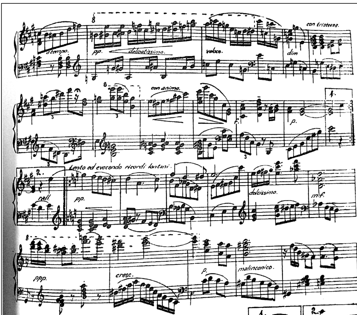
Imagen 8. Segunda página de la obra 'Sonrisa niña' de Emirto De Lima.

Fuente. Duque, E. (2001). Emirto de Lima (1890-1972) Antología: pasillos, danzas y canciones.