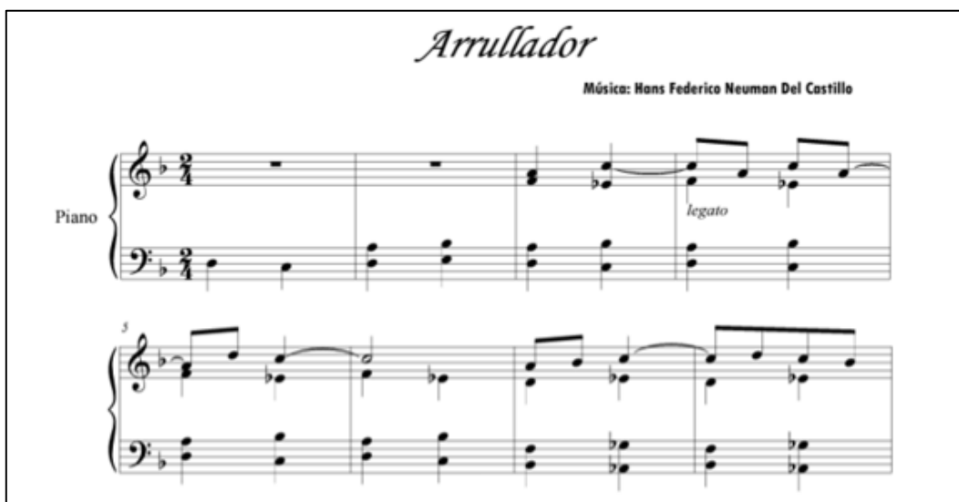
Imagen 4. Primeros sistemas de la obra ‘Arrullador’ de Hans Neuman.

Fuente. Rodríguez, Y. (2014). Hans Federico Neuman Del Castillo, Recopilación Transcrita de su obra (1917 - 1992).