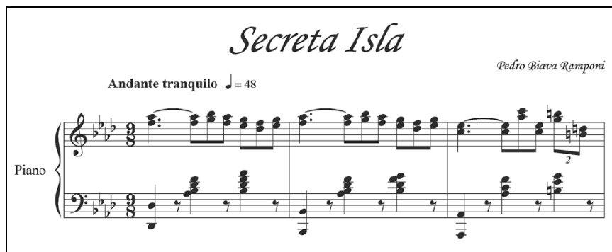
Imagen 5. Primer sistema de la obra ‘Secreta isla’ de Pedro Biava.

Fuente. Rodríguez, Y. (2017). Pedro Biava Ramponi. Vida, recopilación y transcripción de su obra (1902-1972).