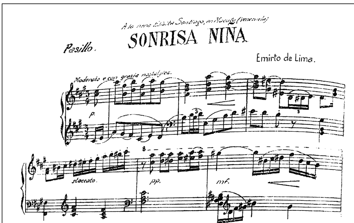
Imagen 7. Primeros sistemas de la obra 'Sonrisa niña' de Emirto De Lima.

Fuente. Duque, E. (2001). Emirto de Lima (1890-1972) Antología: pasillos, danzas y canciones.