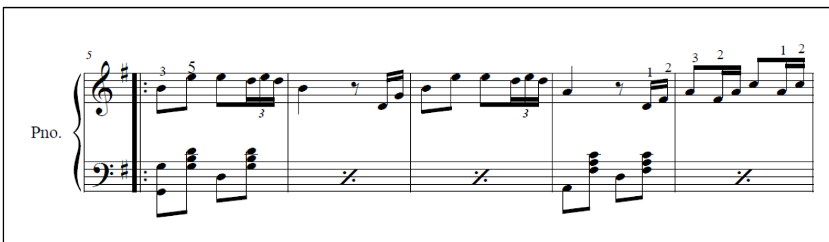
Imagen 2. Segundo sistema del pasodoble ¡Siempre adelante!

Fuente. Torreglosa, N. (2014). Obra musical del compositor Ángel María Camacho y Cano.