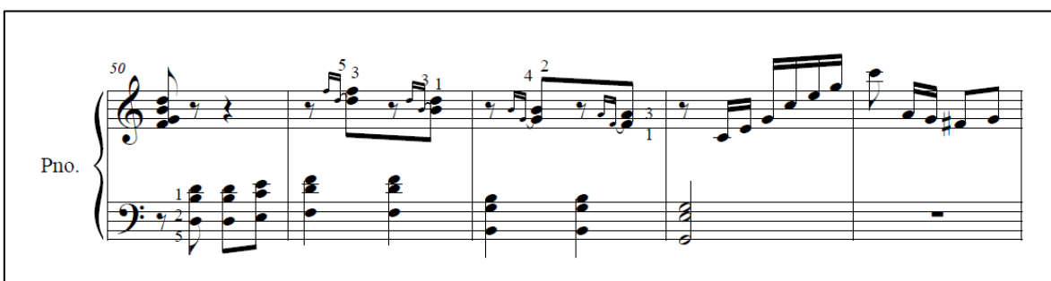
Imagen 3. Onceavo sistema del pasodoble ¡Siempre adelante!

Fuente. Torreglosa, N. (2014). Obra musical del compositor Ángel María Camacho y Cano.