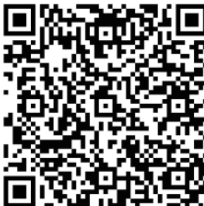
Figura 5 - QR Code do REA