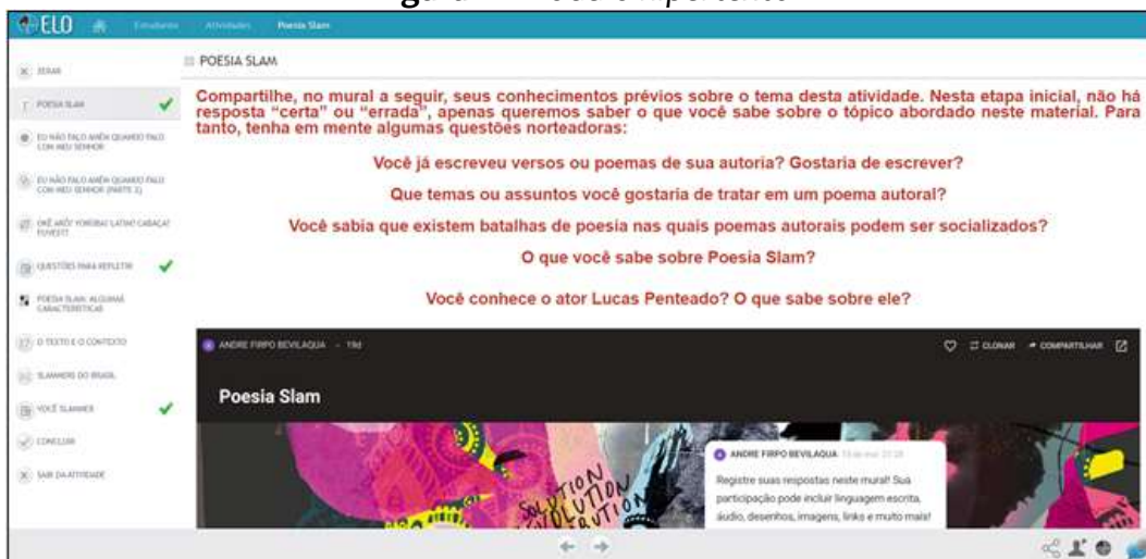
Figura 2 - Módulo hipertexto