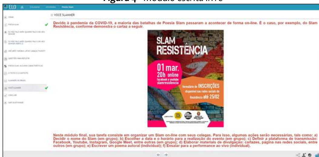
Figura 4 - Módulo escrita livre

Na Figura 3, enquanto o aluno assiste à performance do slammer Lucas Penteado, disponibilizada em vídeo no Youtube e incorporada ao ELO, deve organizar as estrofes do poema na ordem adequada. Esse tipo de atividade, além de facilitar a compreensão do poema, chama a atenção para a natureza multissemiótica da performance , como os gestos que acompanham dois versos da primeira estrofe. Questões desse tipo, assim como outras relativas à produção, distribuição e consumo das performances de Poesia Slam, também vão sendo tratadas no decorrer de outros módulos do REA. No módulo final ( escrita livre ), apresentado na Figura 3, solicita-se que o aluno organize um evento on-line de Poesia Slam em parceria com seus colegas, no qual deverá apresentar um poema de sua autoria. Essa tarefa também vem ao encontro da habilidade (EM13LP46) da BNCC (BRASIL, 2017), conforme apresentamos no início desta seção.