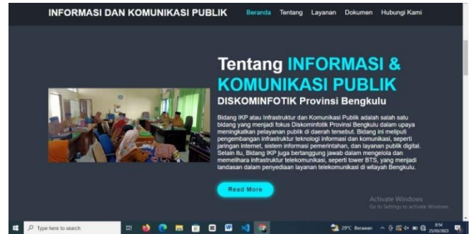
Gambar 4. Tampilan Menu Tentang

Berikut ini adalah contoh untuk Dokumen akan memperlihatkan beberapa pilihan yang bisa diakses. Layanan dengan tiga kategori yaitu Permohonan Informasi, Laporan Pelayanan, dan Layanan Kepuasan Masyarakat. Tentang memberi sedikit pengertian atau profil bidang IKP Diskominfo Provisi Bengkulu.