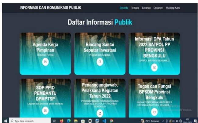
Gambar 2. Tampilan Dokumen Publik

Untuk hasil pengujian yang telah dilakukan dengan menggunakan server lokal / localhost, maka diperoleh hasil dokumen tersedia untuk dibaca secara langsung, dan bisa didownload secara gratis oleh masyarakat umum.