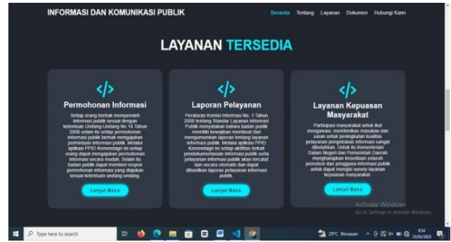
Gambar 3. Tampilan Layanan Tersedia